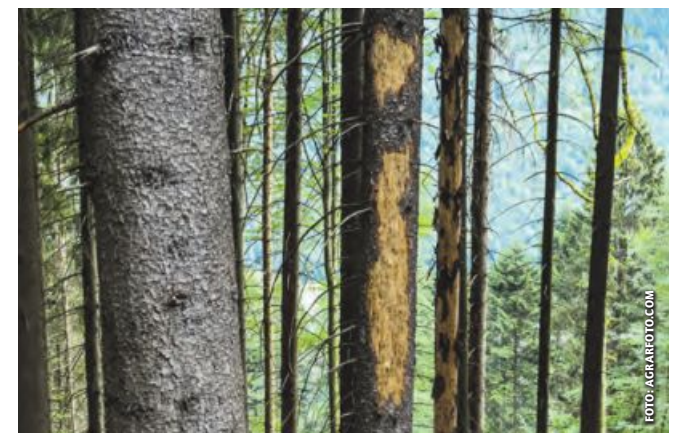
Spechtabschläge mit Buchdrucker-Brutbildern, teils auch bei grüner Krone. Solche Überwinterungsbäume gilt es jetzt aufzuarbeiten.

Sauber in den Winter! Das ist eine zielführende Strategie, um in puncto Borkenkäfer eine möglichst günstige Ausgangslage für das kommende Frühjahr zu schaffen. Denn nur im Herbst und Winter kann man die Population mit weniger Zeitdruck effizient absenken. Dies ist umso bedeutender, als auch das heurige Jahr ein „Buchdruckerjahr“ darstellt. Laut Monitoring des Bundesforschungszentrums für Wald (BFW) konnte das Insekt in Lagen bis etwa 1.000 Meter Seehöhe drei volle Generationen ausbilden.