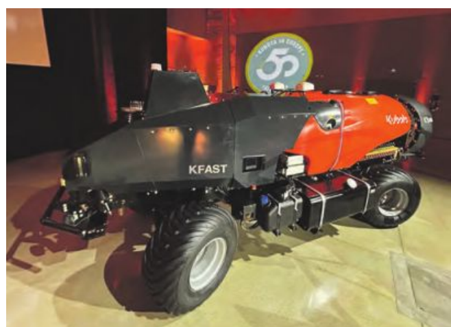
Die KFAST-Plantagenspritze ist vorerst noch ein Prototyp.