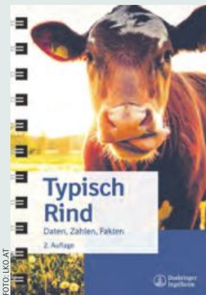
Die Broschüre ist für jeden Milchviehalter nützlich.

und führe zu höherer Infektionsanfälligkeit.