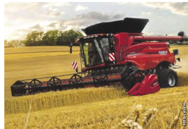
Der Axial Flow 7160 hat einen 12.500-Liter-Korntank.

Die neue AF-Serie gibt derzeit ihr offizielles Europa-Debüt auf der EIMA in Bologna. Mit diesen Einführungen bietet Case IH laut Marco Lombardi, Chef von Case IH & Steyr EMEA, „das weltweit größte Portfolio an Rotormähdreschern an“.