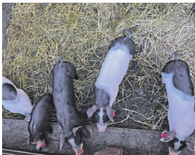
Jedes Jahr kommen etwa 300 Ferkel im Schweinestall zur Welt.

Etwa 15 Prozent der gesamten Fläche Wiens werden landwirtschaftlich genutzt, ein äußerst kleiner Teil davon zur Nutztierhaltung. Von dieser lebt auch der Biohof Maurer in Leopoldau. Die BauernZeitung hat den Hofbesitzer und Stadtlandwirt vor Kurzem besucht.