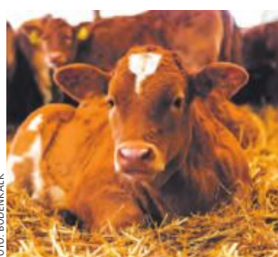
Boka Stall wirkt sich positiv auf das Tierwohl aus.

Ackerflächen, Grünland, Wald, Bauernsacherl, Landwirtschaften dringend gesucht, AWZ: Agrarimmobilien.at , 0664/8984000. 24.46221