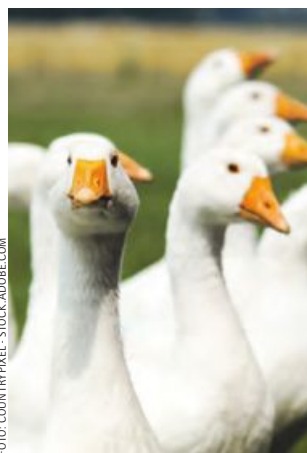
Weidegänse statt Importware.

Die gesetzlichen Vorgaben für Gänse- oder auch Entenhalter in Österreich sind streng. „Sie garantieren ausreichend Bewegungsraum, Bade- und Duschmöglichkeiten für das Wassergeflügel“, weiß Lukas.