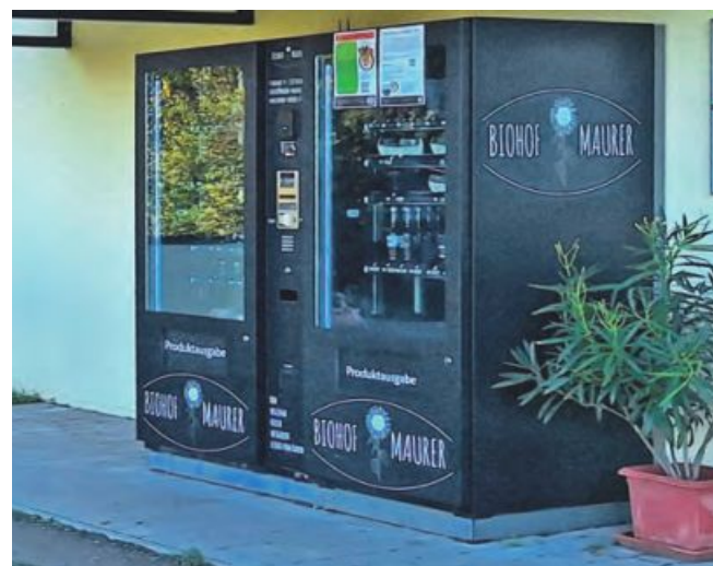
Der Selbstbedienungsautomat liefert rund um die Uhr Hofprodukte.