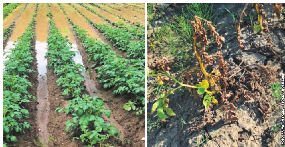
Kartoffel als Risikokultur: Staunässe, Dürre und ansteigender Schädlings- und Pilzkrankheitsdruck.