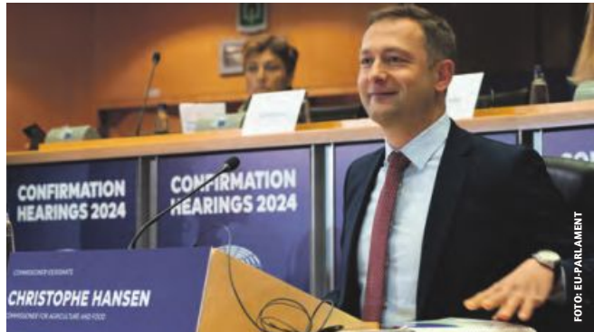
Hansen will sich auf Budget, Bürokratieabbau und Jugend fokussieren.

Am Montag stellte sich Christophe Hansen gut dreieinhalb Stunden lang den Fragen der Abgeordneten des Agrarausschusses im EU-Parlament. Der von Kommissionspräsidentin Ursula von der Leyen für den Posten des Agrarkommissars vorgeschlagene Luxemburger bestach laut agrarheute.com im Hearing durch einen „fachkundigen, konsensorientierten“ Kurs und erntete dafür nach der Sitzung breite Zustimmung der Fraktionen.