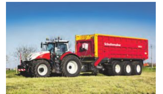
Erstbefeuchtung bei vielen namhaften Firmen.