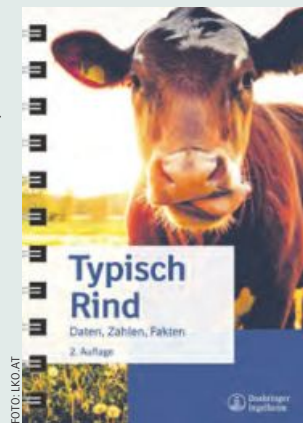
Die Broschüre ist für jeden Milchviehalter nützlich.

und führe zu höherer Infektionsanfälligkeit.