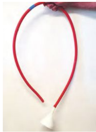
Ein Drench-Bestück sollte in jedem Betrieb vorhanden sein.