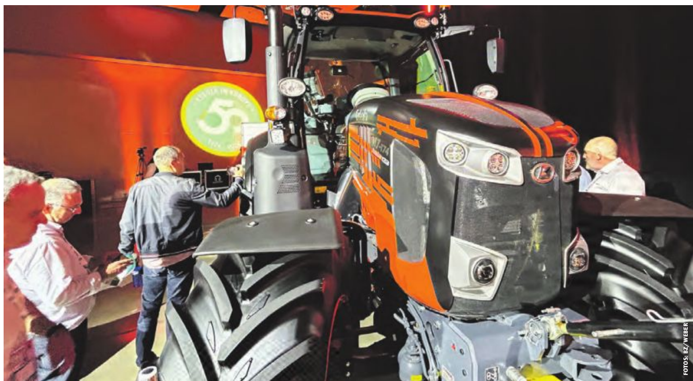
Zum Jubiläum gestaltete Kubota 50 seiner Flaggschiff-Traktoren, das Modell M7-174, in orange-schwarzer Sonderlackierung für Europa.