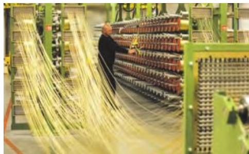
Hightech-Wulstdrahtproduktion ging in Betrieb.

Mehrere Millionen Euro sind mittlerweile in das vor zehn Jahren errichtete, zu den modernsten in Europa zählende Reifenwerk in Otrokovice geflossen. In den vergangenen drei