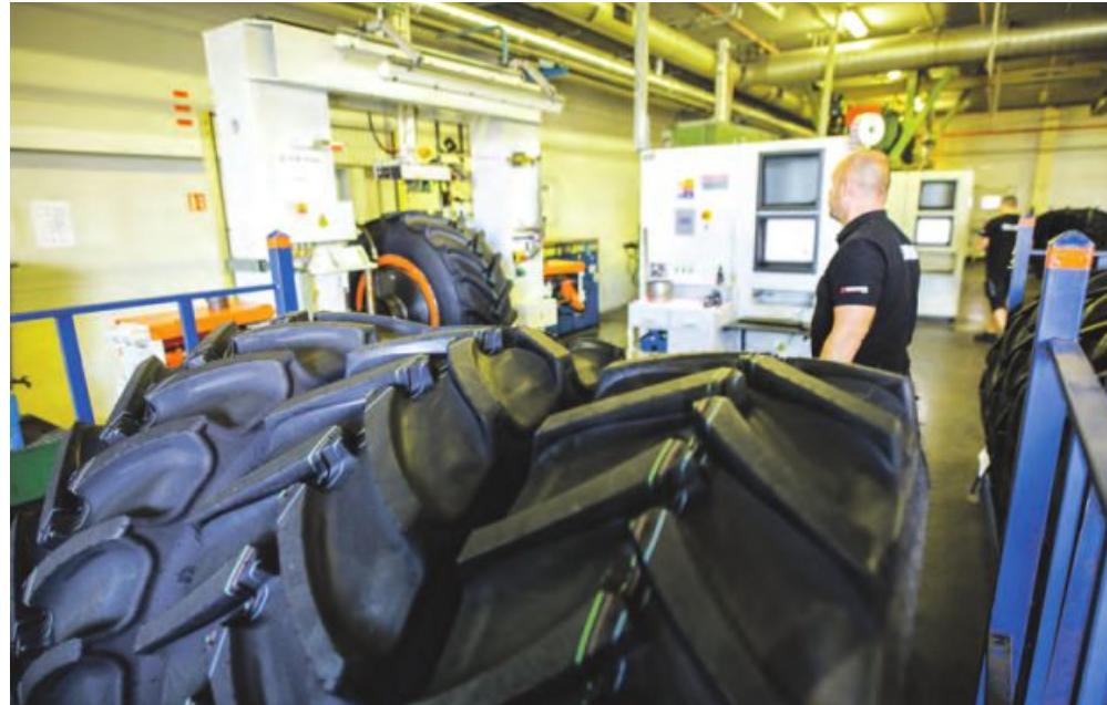
Nahel Zlin in Mähren werden seit den 1930er-Jahren Reifen hergestellt, darunter Agrarreifen von Mitas.