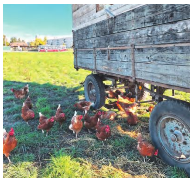
Ihren Hühnerbestand möchten die Maurers künftig verdoppeln.