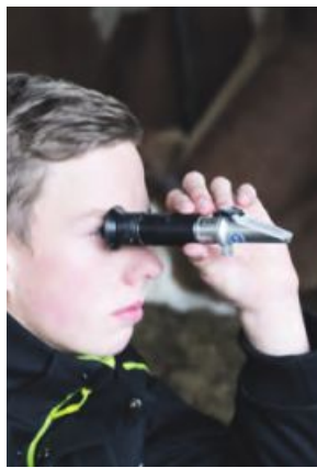
Refraktometer (l.), Senkspindel (m.) und ColostrumCheck eignen sich gleichermaßen zur Qualitätsbeurteilung der Biestmilch.