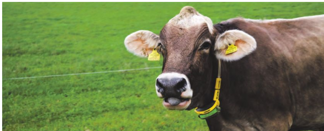
Das Halsband mit eingebauten Sensoren unterstützt die Familie bei der Fütterung und Überwachung der Gesundheit der Milchkühe.