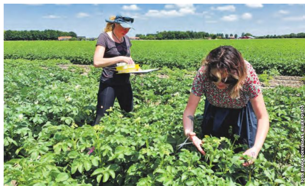
50 gängige europäische Sorten wurden in besonders ertragsrelevanten Wachstumsstadien beprobt.