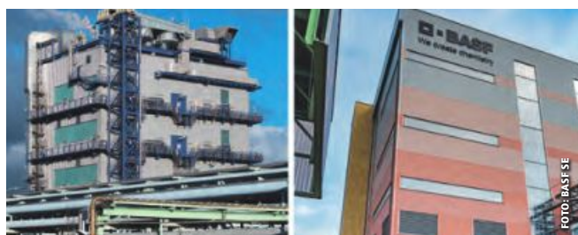
In den Werken Knapsack (li.) und Frankfurt ist demnächst Schluss.

um 7,6 Prozent auf 7,26 Mrd. Euro. BASF begründet dies mit Rückstellungen für Verbindlichkeiten, die aufgrund der angekündigten Schließung der Produktions- und Formulierungsanlagen für Glufosinat-Ammonium in Knapsack und Frankfurt gebildet wurden. Das Ergebnis vor Zinsen, Steuern und Abschreibungen (EBITDA) rutschte nach Sondereinflüssen auf minus 190 Mio. Euro.