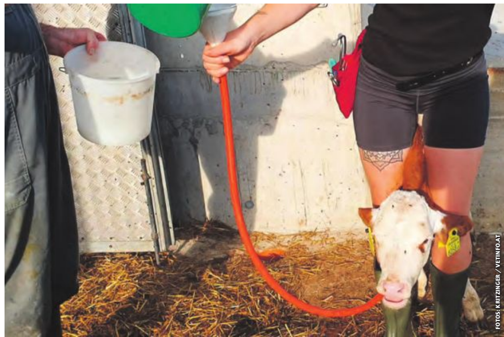
Biestmilchgabe per Drench – am besten eignet sich ein weicher, 150 cm langer Schlauch, der etwa 60 cm (Markierung) in die Speiseröhre reichen soll. Die Kopfhaltung des Kalbes soll waagrecht sein