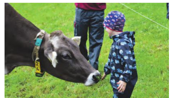
In Zukunft soll sich der Nachwuchs um die Tiere kümmern.

IN KOOPERATION MIT AMA-MARKETING, WERBUNG