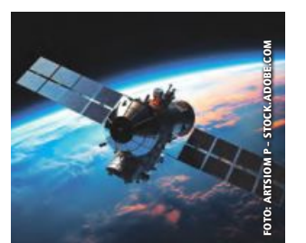
Fernerkundungsdaten können bei der Düngelplanung helfen.

Eine gezielte Mineräldüngung ermöglicht es, den Nährstoffbedarf optimal zu decken, Kosten zu reduzieren und gleichzeitig die Umweltbelastung durch Überdüngung und Stickstoffverluste deutlich zu minimieren. Der Einsatz von Fernerkundungsdaten bietet dabei die Möglichkeit, den Stickstoffbedarf vorherzusagen und darauf basierend die Düngung zu gestalten. Im ÖKL-Webinar „Emissionsreduktion durch optimierte Düngelplanung“ am 19. November von 18 bis 20 Uhr werden die zugrunde liegenden Bedingungen sowie aktuelle Forschungsansätze behandelt. Es referieren Peter Prankl und Stefan Geyer, BLT Wieselburg - Innovation Farm. Die Veranstaltung ist anrechenbar (1 UE EEB; ÖPUL 23-27: Einschränkung ertragssteigernder Betriebsmittel). Die Teilnahmegebühr beträgt 22 Euro. Anmeldung online unter: oekl.at/webshop/veranstaltungen