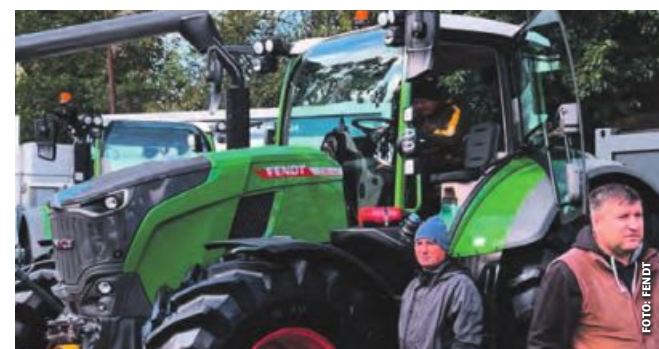
Für Fendt gab es zuletzt Auszeichnungen in Moldau und Finnland.

Auf der größten Freiluft-Fachmesse der Republik Moldau „Moldagrotech“ wurde im Oktober der Fendt 728 Vario mit dem Innovationspreis „Grand Prix“ als „Neuheit des Jahres“ ausgezeichnet. Der 303 PS starke Traktor überzeugte mit dem Antriebsstrang VarioDrive, seiner intuitiven Bedienung sowie dem Mehrleistungskonzept Fendt DynamicPerformance. „Zusätzlich arbeitet der Traktor besonders