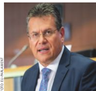
Sefcovic forciert Mercosur.

Um den Reigen an Handels erleichterungen auch rasch zu ratifizieren, plant er mit Rat und Parlament eine Grundlage zu erarbeiten, auf deren Basis so viele Handels- und Investitionsabkommen wie möglich durch die EU-