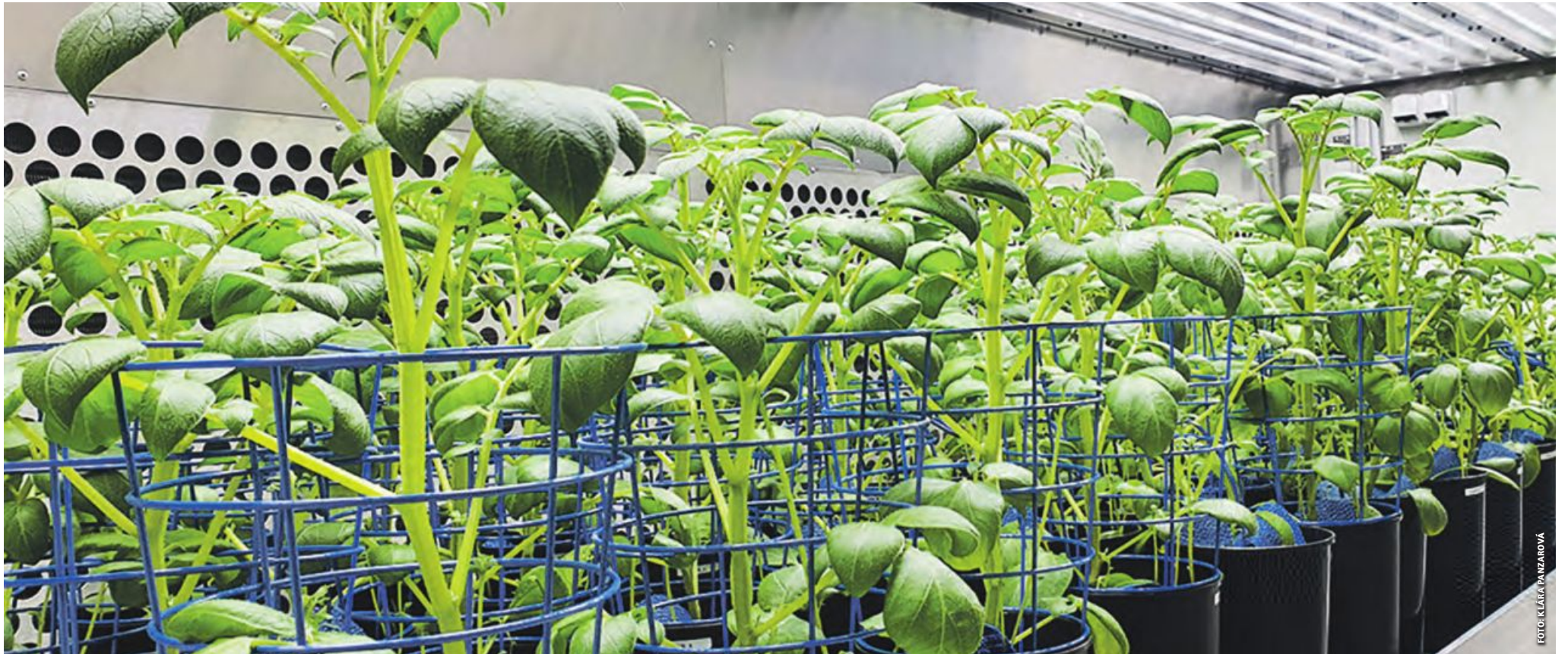
Zehn Forschungseinrichtungen untersuchten Kartoffelsorten unter Laborbedingungen und im Feldversuch auf ihre Stresstoleranz. Die gewonnenen Erkenntnisse fließen nun in die Züchtung neuer Sorten ein.