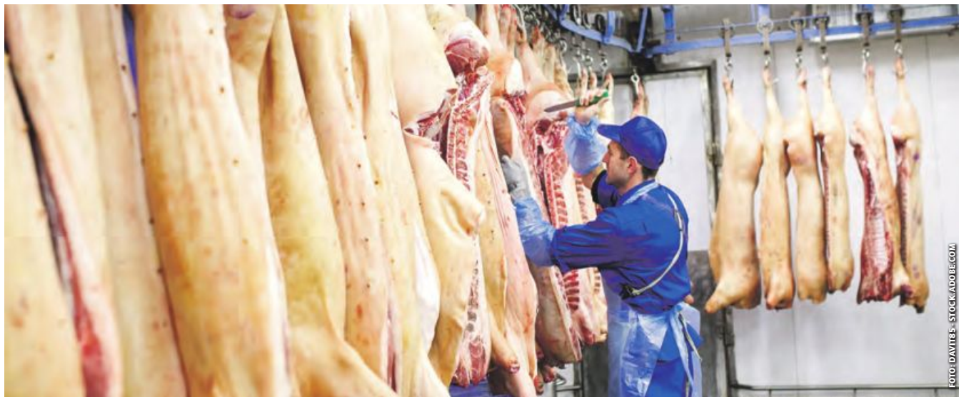
Bei Europas Schlachtkonzernen soll mehr Tierwohl an den Haken. Vion verbindet dies, nach einem Millionendefizit, mit einer Umstrukturierung.