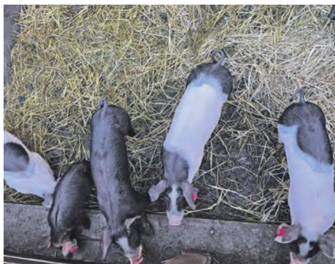
Jedes Jahr kommen etwa 300 Ferkel im Schweinestall zur Welt.

Etwa 15 Prozent der gesamten Fläche Wiens werden landwirtschaftlich genutzt, ein äußerst kleiner Teil davon zur Nutztierhaltung. Von dieser lebt auch der Biohof Maurer in Leopoldau. Die BauernZeitung hat den Hofbesitzer und Stadtlandwirt vor Kurzem besucht.