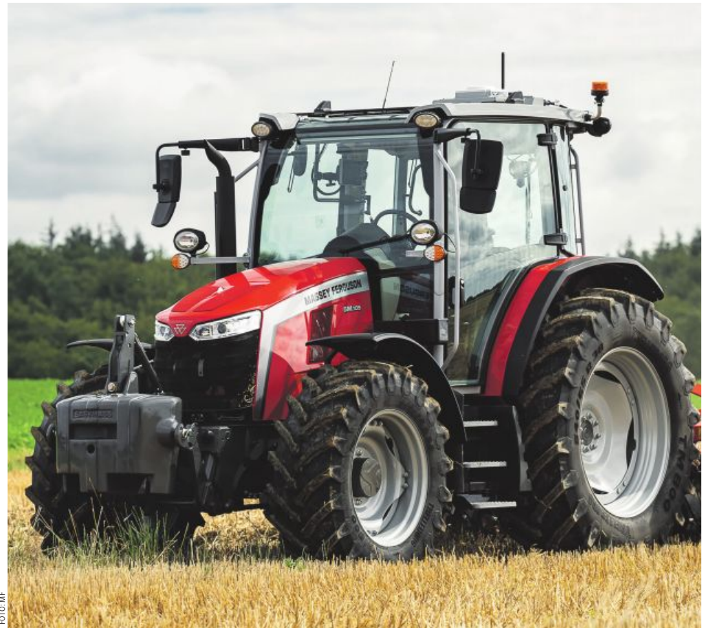
In den neuen MF 5M arbeiten bewährte Vierzylindermotoren von AGCO Power mit 4,4 l Hubraum.

Die Traktoren sind kompatibel mit vielen werkseitigen Ladern. Dank des Wenderadius von nur 4,65 Metern braucht man nur wenig Platz. Bedient werden die Frontlader und das Getriebe mit einem mechani-