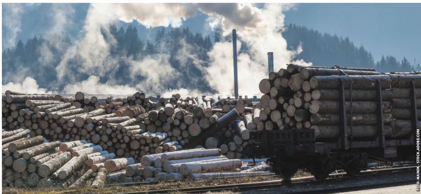
Für zahlreiche Rohstoffe sieht die EUDR zusätzliche Auflagen vor. Österreichs Bauern würden diese bei Holz, Rindfleisch und Soja betreffen.

Um die Anfang Oktober von der EU-Kommission angekündigte zeitliche Verschiebung der Entwaldungsverordnung, kurz EUDR, möglichst rasch umzusetzen, hat das EU-Parlament einer Abwicklung im Eilverfahren zugestimmt. Die Abstimmung ist für Mitte November anberaumt.