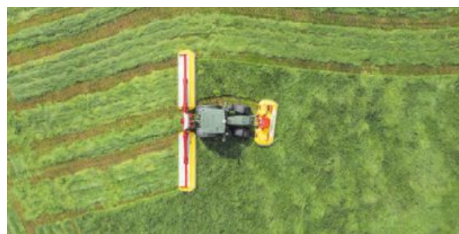
Optimaler Überschneidung in Kurvenfahrt

Das Herzstück dieses Mäherwerks ist der tausendfach bewährte Mähbalken. Die Balkenhöhe von nur vier Zentimetern garantiert optimalen Futterfluss. Die Balkentiefe von lediglich 28 Zentimetern steht für beste Boden Anpassung. Die abgeflachte Balkenvorderseite lässt die Erde unterseitig gut abfließen und trennt diese sauber vom Mähgut. Bei allen NOVACAT F Modellen drehen standardmäßig alle Mähscheiben nach innen. Dies stärkt den Futterfluss über den Mähbalken und unterstützt die Schwadbildung, um das Futter innerhalb der Traktorspur