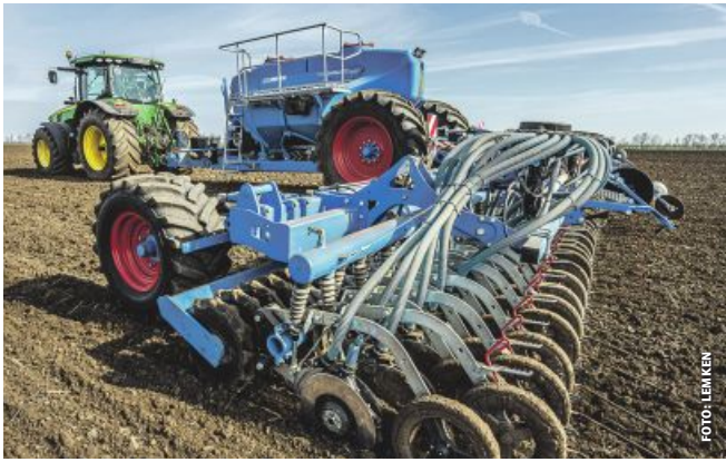
Die Solitair ST: 12 Meter Arbeitsbreite und bis zu 7.000 Liter Tank

Mit der neuen Solitair ST mit 12 Metern Arbeitsbreite wendet sich Lemken speziell an Großbetriebe, die flexibel, effizient und schlagkräftig aussäen wollen.