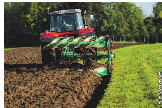
Für Teilnehmer an den ÖPUL-Maßnahmen UBB oder BIO gilt eine Grünland-Umbruchtoleranz von maximal einem Hektar.

Im Österreichischen Umweltprogramm ÖPUL 2023 besteht eine Pflicht zur Erhaltung des Grünlands. In einer aktuellen Aussendung erläutert die AMA die eng gefassten Umbruchtoleranzen. Konkret gilt die Verpflichtung zur Grünlandhaltung in drei Maßnahmen: