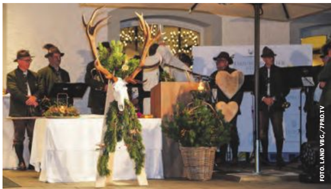
Gut 300 Gäste fanden sich zur Hubertusfeier der Jägerschaft ein.

Die Vorarlberger Jägerschaft versammelte sich am 19. Oktober am Kaiserstrand in Lochau zur traditionellen Hubertusfeier, um dem Schutzpatron der Jäger und Forstleute zu gedenken. Landesrat Christian Gantner überbrachte den rund 300 Gästen Grüße der Landesregierung und dankte den Jägern für ihren Einsatz. Ein Höhepunkt der Feierlichkeiten war die Überreichung von 26 Jägerbriefen und eines Jagdschutzbriefs.