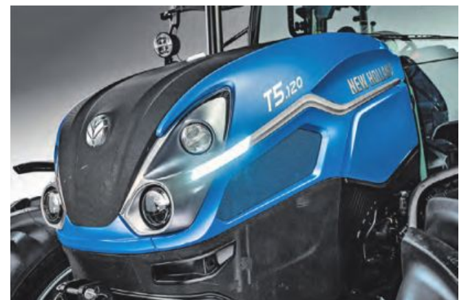
Modernes Design mit effizienten LED-Lichtlösungen

Echtzeit überwachen und steuern. Dies ermöglicht fundierte Entscheidungen, die die Effizienz steigern und die Betriebskosten senken. Die Precision-Farming-Technologien helfen, Ressourcen zu schonen und die Produktivität auf höchstem Niveau zu halten.