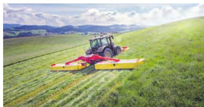
NOVACAT H Mähkombinationen: Höchste Schlagkraft

abzulegen und das Überfahren zu vermeiden. Das sorgt außerdem für Einsatzsicherheit auch beim Bergabmähen.