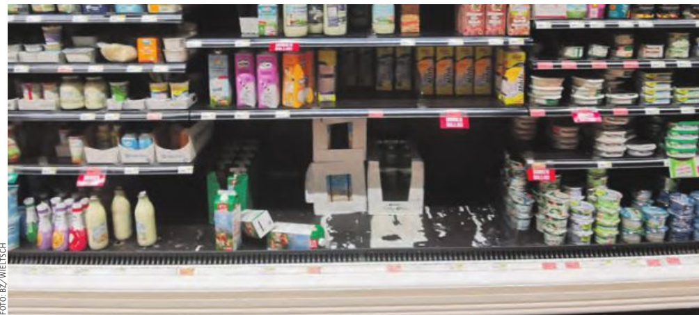
Zum Wochenstart beginnende Leere im Spar-Milchregal. Statt NÖM liefert nun etwa Berglandmilch.