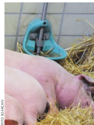
Schalen- und Beckentränken sorgen für ein ausreichendes Wasserangebot.

Die Symptomatik entsteht in Wechselwirkung mit der Umwelt. Das erklärt, warum Betriebe unterschiedlich betroffen sind. Ungünstige Bodenverhältnisse führen zu Symptomen an den Klauen, Mängel bei der Thermoregu-