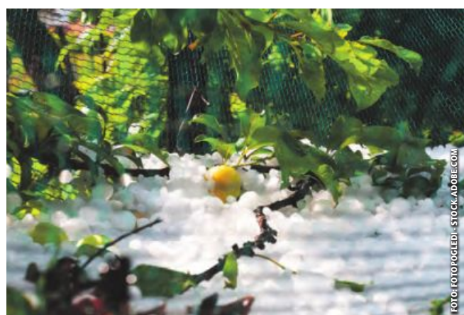
Hagelschlag hat zumeist besonders teure Folgen für die Bauern.