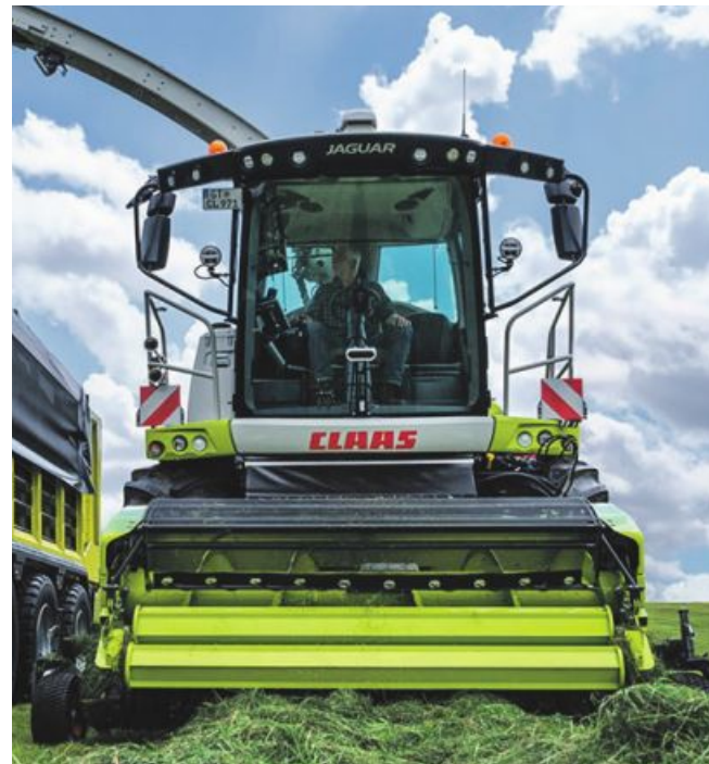
Der neue Jaguar hat viele neue Entwicklungen mit an Bord.

Die V-Flex-Messer sind als Gras- wie auch Maismesser erhältlich. Die Befestigung am verschleißfesten Grundkörper erfolgt mit jeweils drei