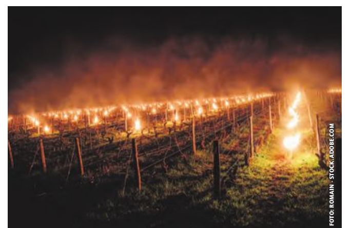
Auf mildes Frühjahr folgt Kälteeinbruch: Spätfröstegefahr nimmt zu.