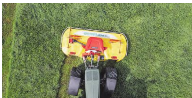
OPTICURVE bietet einen bogenförmigen Verschiebeweg von +/- 20 cm

Sowohl in Kurvenfahrten, als auch in Hanglagen, wenn der Traktor seitlich abdriftet, wird dank Verschub in Richtung Kurven-Innenradius kein ungemähtes Futter mit