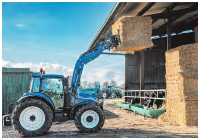
Ein Highlight ist der ab Werk erhältliche Frontlader.

Das digitale Armaturenbrett bietet eine übersichtliche Anzeige aller wichtigen Maschinenparameter, was die Bedienung erleichtert. Ein weiteres Highlight ist die Auto-Funktion für Allradantrieb und Differenzialsperre. Diese Systeme werden automatisch aktiviert, wenn sie benötigt werden, was die Effizienz erhöht und den Kraftstoffver-