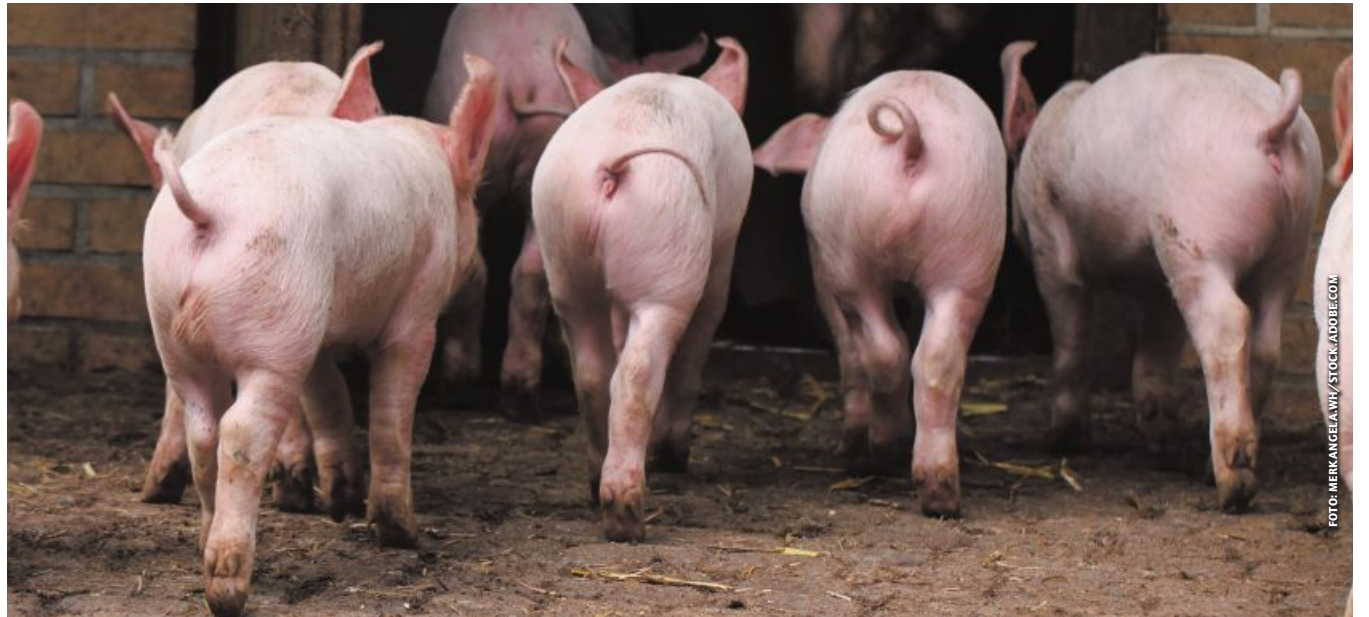
Seit Anfang 2023 muss jeder Schweinehalter Schwanz- und Ohrverletzungen in seinem Tierbestand ermitteln und darüber eine „Tierhaltererklärung“ abgeben. Bei der Haltung kupierter Schweine ist zusätzlich eine „Risikoanalyse“ notwendig.

Eine Schlüsselfunktion hat zudem die Fütterung. Ausreichend Kolostrum ist essenziell. Auf Zucker oder Antibiotika in den ersten Lebenstagen sollte verzichtet werden.