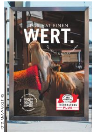
AMA-Gütesiegelkampagne für das Modul „Tierhaltung plus“.

Verwendet werden die Beiträge vor allem für die Bewerbung landwirtschaftlicher Produkte aus Österreich mit dem AMA-Gütesiegel. Neu in Ausarbeitung ist derzeit das AMA-Gütesiegel für Brot und Gebäck. Ende 2023 waren laut Bericht etwa