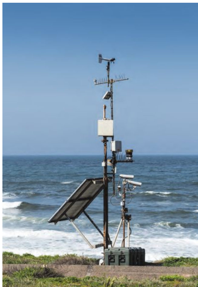
Um Wetterprognosen noch genauer zu erstellen, braucht es mehr Messstationen auf allen Kontinenten und aus den Meeresregionen..