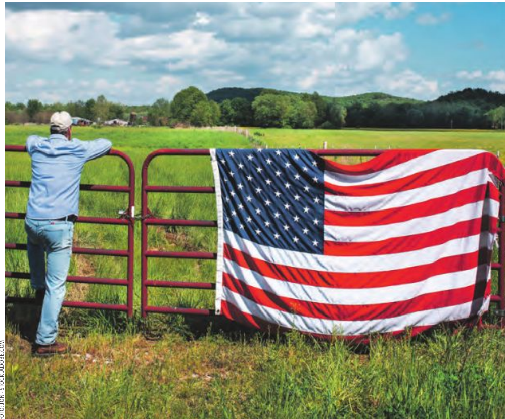
78 Prozent der US-Farmer rechnen nach der Präsidentschaftswahl mit politischen Veränderungen.

Beinahe acht von zehn der Befragten (78 %) machen sich Sorgen, dass es nach den Präsidentschaftswahlen zu politischen Ver-