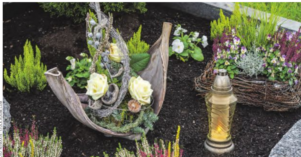
Klassische Blumenarten prägen auch heuer den Allerheiligen-Grabschmuck. Auch Regionalität punktet.

Egal in welcher Größenordnung und mit welchem Budget die Gräber verziert werden, die Verbundenheit und die Erinnerung sind wohl das Wichtigste.