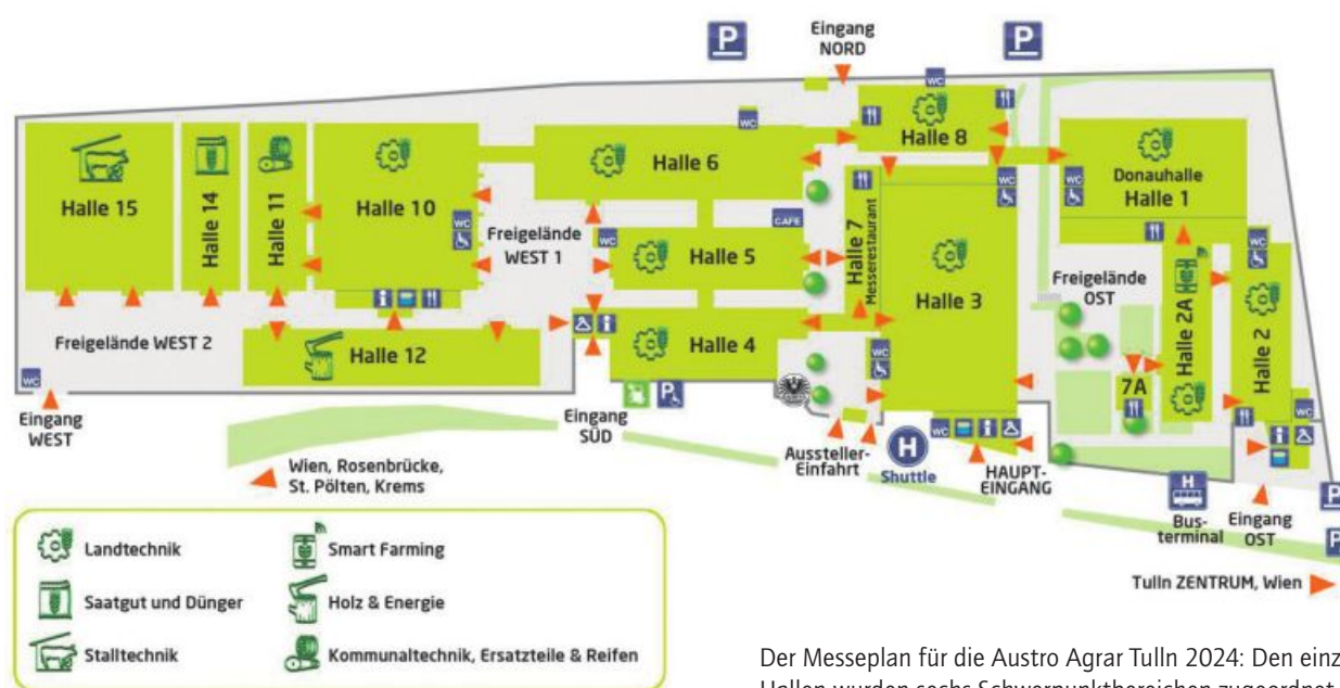
Der Messeplan für die Austro Agrar Tulln 2024: Den einzelnen Hallen wurden sechs Schwerpunktbereichen zugeordnet.

Als langjähriger Insider der Branche – er war unter anderem Geschäftsführer von Deutz-Fahr Austria sowie später Generalimporteur von