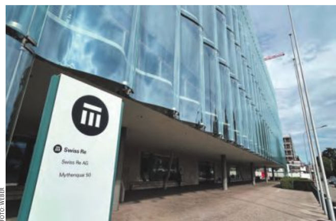
SwissRe-Zentrale in Zürich. Rückversicherer für 80 Länder weltweit.

Auf 45 Milliarden US-Dollar ist das jährliche Versicherungsvolumen weltweit allein im Pflanzenbau gestiegen, um Schäden auf gefluteten Weizenfeldern, verdorrten Maisäckern, verhägelten Apfelplantagen oder erfrorenen Rebanlagen teilweise abzudecken.