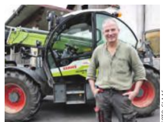
Mit Claas zum Edelschinken.