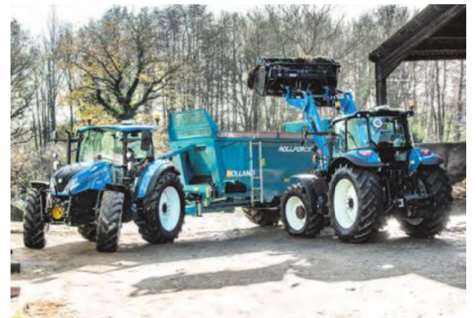
Der neue T5 Dual Command ist besonders auf Vielseitigkeit ausgelegt.

Darüber hinaus bietet der T5 Dual Command eine Echtzeitdatenübertragung zu Maschinenparametern und dem Betriebsstatus. Über die New Holland FieldOps-Plattform können Landwirte ihre Maschinenflotte und die Arbeit auf den Feldern in