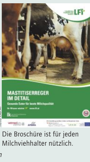
Die Broschüre ist für jeden Milchviehhalter nützlich.

liefern, da hier die Zellzahl regelmäßig in kurzen Zeitabständen ermittelt wird.