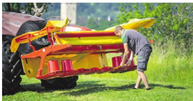
Einfacher Klappenwechsel dank großzügiger Schutzklappung

dem Hinterreifen des Traktors überfahren. Außerdem bleibt kein Futterstreifen wegen zu geringer Überlappung zum Heckmäherwerk ungemäht stehen. Der Anbaubock vom NOVACAT F 3100 OPTICURVE ist kompakt gebaut und bietet freie Sicht nach vorne.