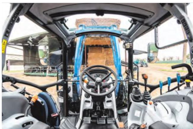
Die Comfort Ride-Kabine bietet hervorragende Rundumsicht.

brauch senkt. Der Fahrer muss nicht manuell eingreifen, was die Bedienung vereinfacht und den Traktorstets optimal an die Arbeitsbedingungen anpasst.