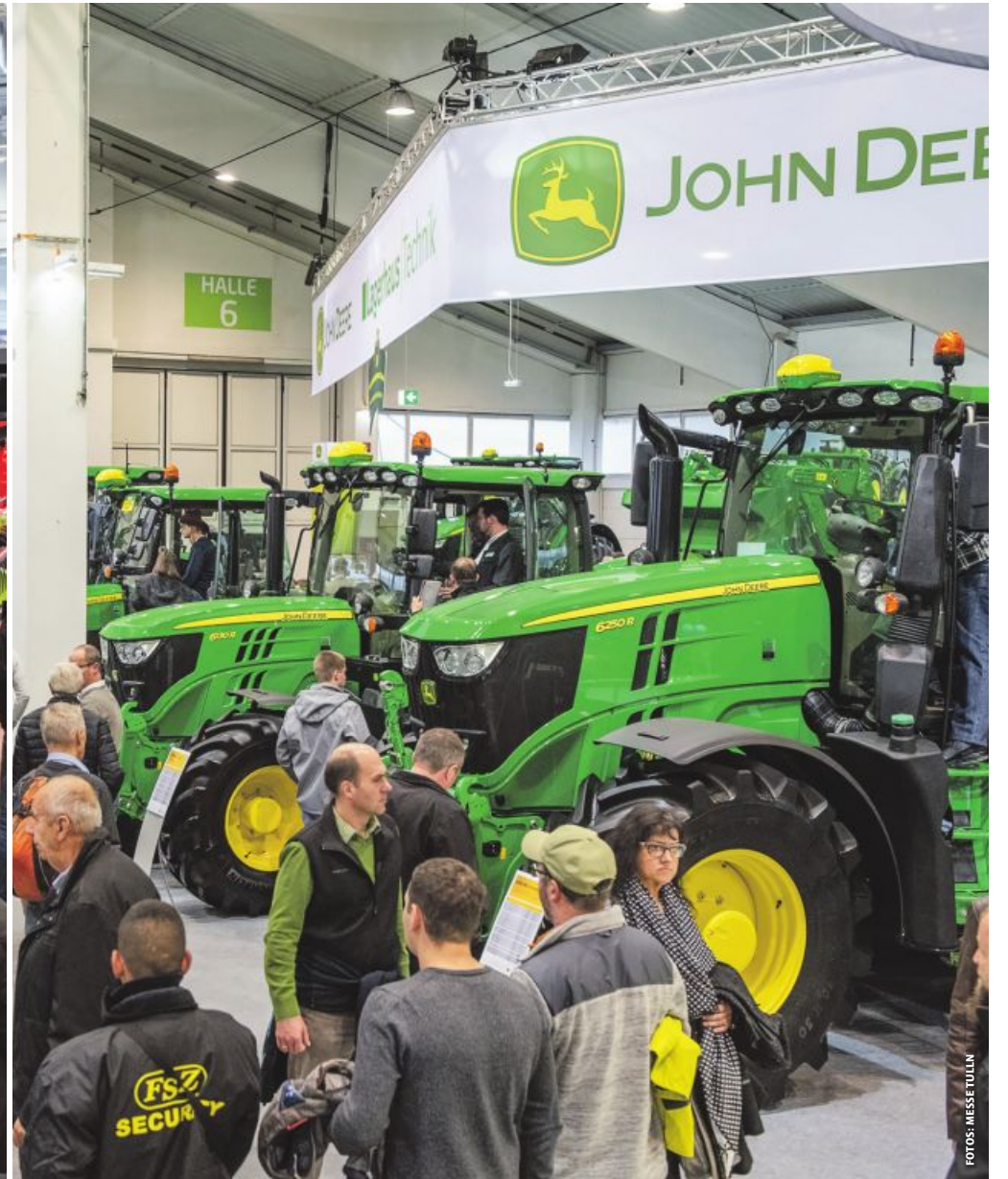
Nach dem Absatz-Hype vor drei Jahren herrscht aktuell Flaute am Landtechnikmarkt. 320 Aussteller, allesamt Hersteller oder Generalimporteure, zeigen auf Österreichs großer Agrartechnik-Schau ihre Neuheiten.