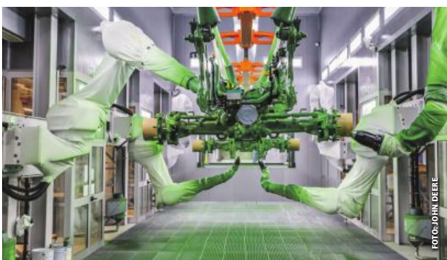
Roboter bei der Arbeit in der neuen Lackieranlage.

Mehr als 80 Millionen Euro investiert John Deere in die Weiterentwicklung der Endmontage im Werk Mannheim in Deutschland. Im Oktober wurde nun eine vollautomatische Farbgebungsanlage in Betrieb genommen. Sie verspricht mehr Energieeffizienz und weniger Lärm. „Diese Investition ist auch ein wichtiger Schritt zur klimaneutralen Fabrik, mit vielen weiteren Vorteilen für die Umwelt“, teilt der Traktorhersteller mit. Auch die Kunden sollen von der neuen Anlage profitieren. Denn durch die Automatisierung des Lackierprozesses werde eine gleichbleibend hohe Qualität gewährleistet.