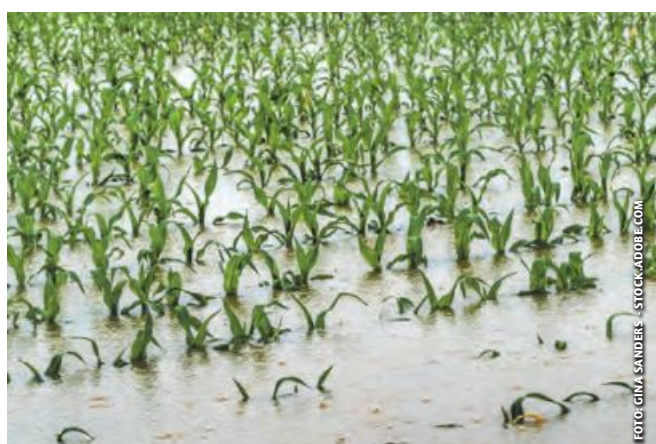
Mais unter Wasser: Unwetterschäden in der Landwirtschaft steigen.