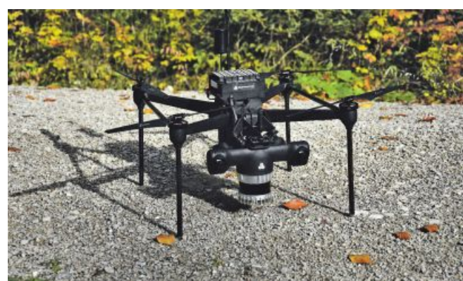
Die RevoWood-Drohne fliegt zur Bestandsaufnahme unter dem Kronendach zwischen den Stämmen hindurch.