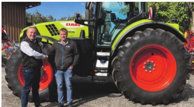
Kupfner und Claas freuen sich über ihre Partnerschaft.