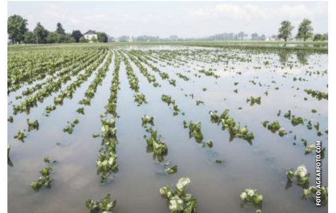
„Land unter“ in der wichtigen Rübenregion Tullnerfeld.