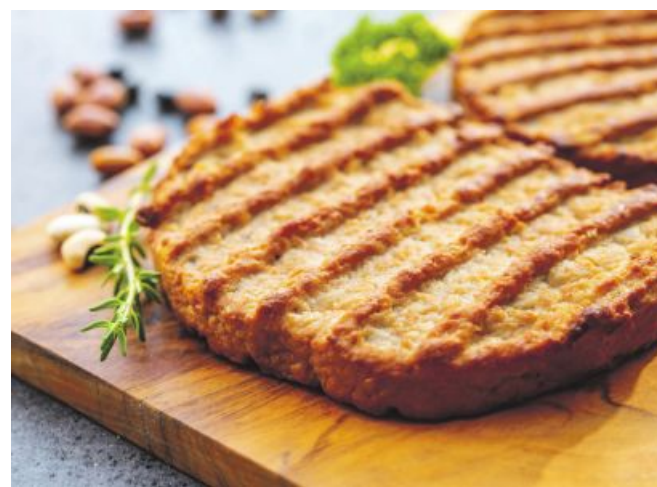
Wird der Begriff „Steak“ nicht auf nationaler Ebene gesetzlich klar geregelt, darf er auch nicht für pflanzliche Erzeugnisse verboten werden.

Die Richter in Luxemburg waren als Höchstinstanz aktiv geworden, nachdem eine NGO und der Ersatzprodukt hersteller „Beyond Meat“ Klage gegen ein Dekret der französischen Regierung eingereicht hatten. Wie Agra-Europa berichtet, sollten dem Gesetz zufolge Begriffe wie „Steak“ oder „Wurst“ nicht