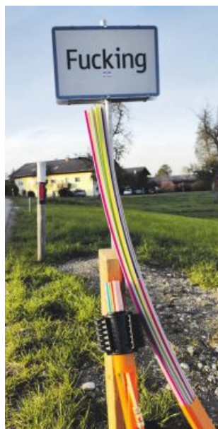
Vorrangig werden Glasfaserkabel auf öffentlichem Gut verlegt.

Daher spricht es dafür, die Dinge im Vorfeld gut zu klären und festzulegen, damit es bei allfällig auftretenden Problemen wie beschädigten Drainagen und Versorgungsleitungen der Grundeigentümer, Bauschäden, unzureichenden Angaben zur tatsächlichen Leitungslage oder einer zu oberflächennahen Verlegung der Datenkabel nicht zu hohen Reparaturkosten und Schadenersatzforderungen kommt.