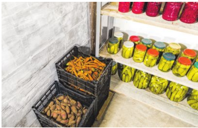
Die kühlen Keller eignen sich für die Lagerung besonders gut.

Beim Einfrieren ist es wichtig, das Gemüse vorher zu waschen, zu zerkleinern und zu blanchieren, um die Haltbarkeit zu verlängern. Einmachen und Fermentieren sind energiesparende Konservierungsmöglichkeiten. Essig tötet durch seinen niedrigen pH-Wert Mikroorganismen ab und verhindert deren Wachstum. Fermentieren erzeugt zusätzliche Vitamine und hat einen positiven Effekt auf die Darmflora. Wichtig ist, dass das Gemüse während der Gärung stets von der Salzlake bedeckt bleibt, um Schimmelbildung zu verhindern.