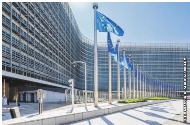
Berlaymont-Gebäude in Brüssel: Warten auf die neuen Kommissare.