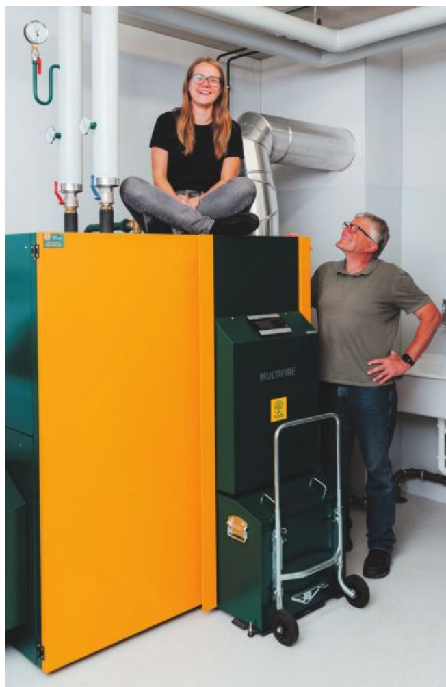
Kunden von KWB wissen: Heizen mit Holz gibt ein gutes Gefühl.