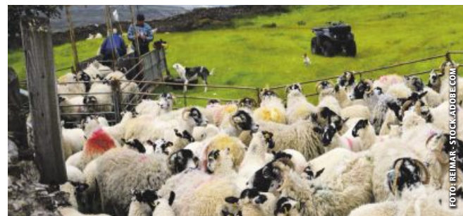
Paris trägt die Kosten für BTV-Impfungen für Schafherden.

FNSEA-Präsident Arnaud Rousseau bezifferte den tatsächlichen Finanzbedarf auf 150 Mio. Euro. Wenn der Staat „den Zusammenbruch der Tierhaltung“ verhindern wolle, könne die angekündigte Unterstützung nur ein erster Schritt sein, so Rousseau.