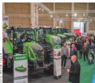
Die Vorbereitungen auf die Messe laufen auf Hochtouren.