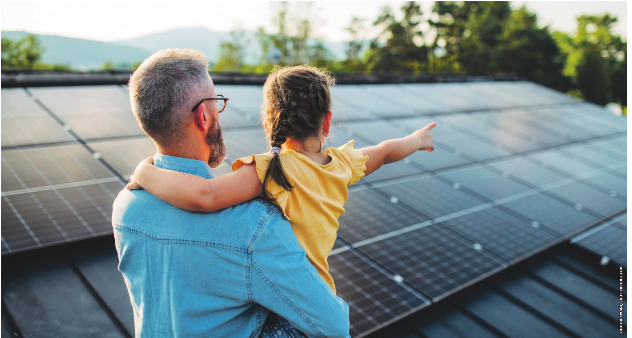
Mit KWB-Systemen gelingt die Energiewende zuhause und im Betrieb. Photovoltaik und Solarthermie bilden die perfekte Ergänzung zu jeder Holzheizung. Die einzelnen Komponenten sind ideal aufeinander abgestimmt.

Am Anfang von KWB stand eine Vision: Weg von fossilen, hin zu erneuerbaren Energieträgern – und diese so einfach und sauber wie möglich nutzbar zu machen. Ziel war nicht weniger als eine Revolution unserer Energieversorgung für eine intakte Umwelt und die nächsten Generationen. Das war im Jahre 1994, als dieser ökologische und zutiefst nachhaltige Ansatz noch alles andere als selbstverständlich war. Die effizienten Heizsysteme des Newcomers waren schon damals überzeugend und so dauerte es nur drei Jahre, bis der ursprüngliche Standort in Graz zu klein wurde und man nach St. Margarethen an der Raab zog. Damit fing der Erfolgslauf von KWB erst so richtig an.