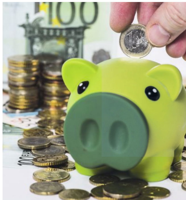
Die Teuerung hat deutlich nachgelassen. Auch wenn jetzt die Zinsen fallen, bleibt Sparen die Kaufkraft erhalten.

Auch auf EU-Ebene hat das europäische Statistikamt Eurostat für den September eine niedrige Teuerungsrate von 1,8 Prozent gemeldet. Die für die EZB-Zinsmaßnahmen wichtige Kerninflation (Anm.: die Teuerung ohne die volatilen Energie- und Lebensmittelpreise) fiel von 2,8 auf 2,7 Prozent.