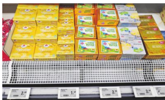
Die Verbraucherpreise für Butter sind wieder auf dem Rekordniveau von 2022. Bei den Milchbauern kam das Plus vorerst noch nicht an.

Medial wird der Preisauftrieb mit starken Worten kommentiert wie „Butterkrise in der EU“ oder „Teuerungsschock“. Bei einem Pro-Kopf-Verbrauch von knapp 5,5 kg in Österreich sollte die Preissteigerung aber verkraftbar sein. Begründet ist der Preisauftrieb in der saisonal niedrigen Milchlieferung, die insbesondere in den Niederlanden und in Norddeutschland zusätzlich durch die Epidemie der Blauzungenkranke gedämpft wird. Die Nachfrage nach Milchfett wird demgegenüber als „lebhaft“ beschrieben.