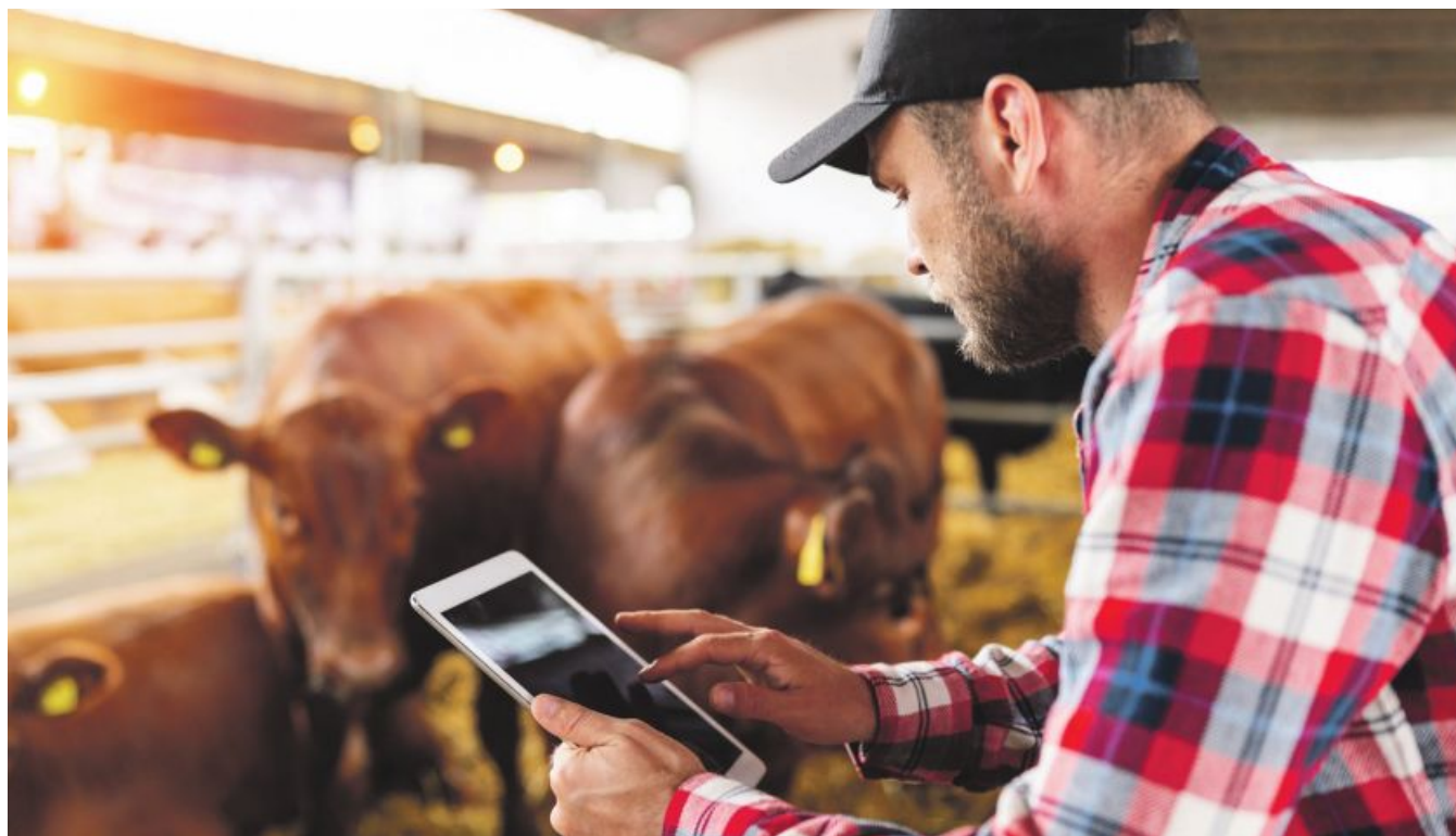
In der Landwirtschaft wird schnelles Internet besonders benötigt: am Feld, rund um den Maschineneinsatz, im Stall und im Hofbüro.

Wie lässt sich eine oft lahme Internetanbindung auf landwirtschaftlichen Betrieben im in Sachen Breitband unterversorgten ländlichen Raum verbessern? Ein neuer Ratgeber gibt darauf Antworten.