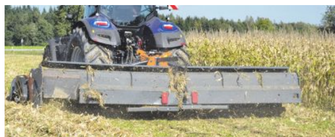
Der „BioChipper“ führt die Erntereste zu einem Schwad zusammen.

Das Energiepotenzial von Feldresten ist enorm: Mit Maisstroh eines Hektars können laut Angaben von BioG zirka 1.200 Liter Öl ersetzt und dadurch zirka drei Tonnen CO 2 eingespart werden. Im Gegenzug soll man je nach Erntetechnik nur zirka 30 bis 40 Liter Treibstoff für den Abtransport dieser Feldreste brauchen. „Würde man in Österreich sämtliche Reststoffe auf Biomethan umwandeln, könnten dadurch rund 25.000 Lkw oder 150.000 Schlepper mit regionalem Treibstoff versorgt werden“, weiß man bei der Firma.