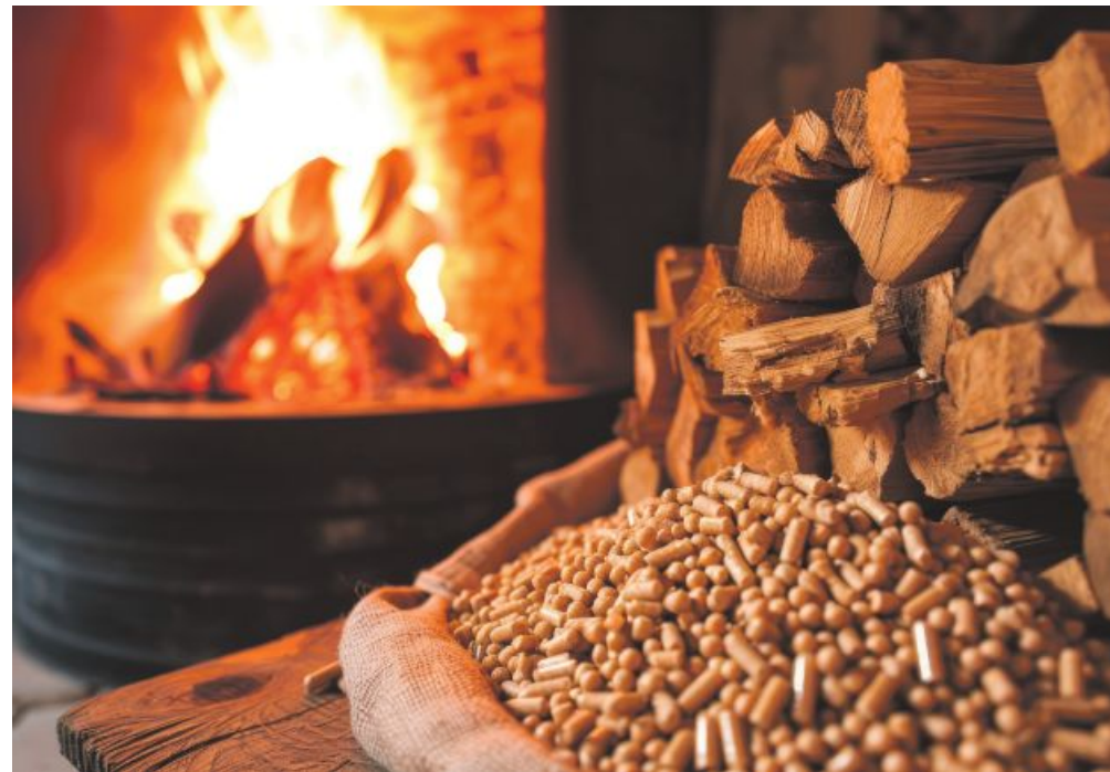
Die Raumwärme der heimischen Haushalte wird zu mehr als 40 Prozent aus Biomasse erzeugt.

Wie in der Broschüre „Energie aus Holz“ des LFI und der LK Österreich nachzulesen ist, nutzen stattdessen rund 750.000 Haushalte in Österreich den biogenen Rohstoff in Einzelfeuerungen als primäres Heizsystem. Hinzu kommen 600.000 Nahwärmekunden, die von 2.500 Biomasseheizwerken mit Wärme versorgt werden.