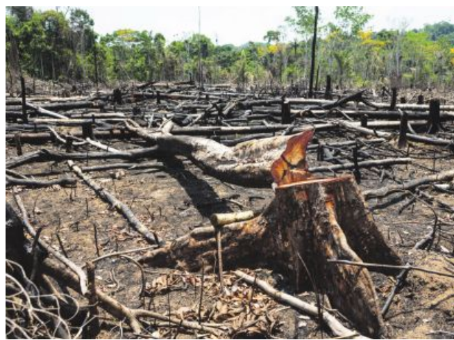
Entwaldungsverordnung soll der Regenwaldrodung entgegenwirken.

Für Bernhuber ist nun entscheidend, „den Druck weiter aufrechtzuerhalten, um am Ende eine umfassende Änderung des Gesetzestextes zu erreichen“. Eine rein zeitliche Verschiebung reiche nicht. Benötigt werde ein Instrument, das die Entwaldung in Brasilien oder Indonesien effektiv verringert, „ohne dass es zu einer reinen Bürokratie-Schikane für die Land- und Forstwirte in der EU führt“, so Bernhuber.