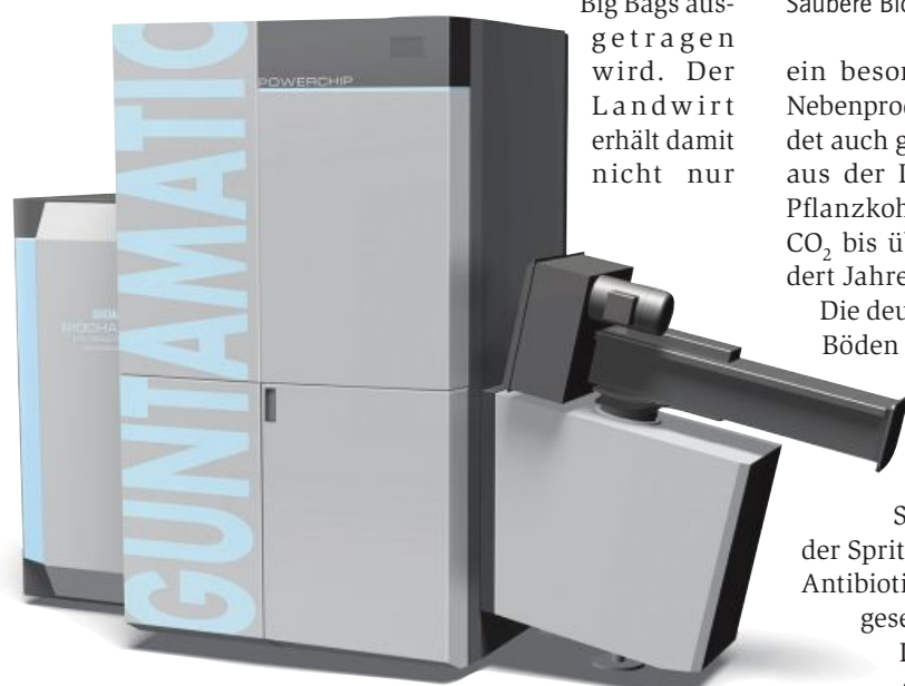
Eigene Pflanzenkohle erzeugen oder PV-Überstrom in Wärme umwandeln.

Mehr Informationen gibt es von 12. bis 15. November 2024 auf der EuroTier in der Halle 25, Stand G23 oder auf der Webseite www.guntamatic.com