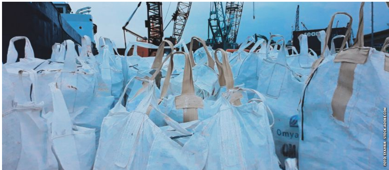
Seit September 2023 spülen Exportzölle auf Dünger zusätzlich Geld in die Kassen des Kreml. 2025 soll damit Schluss sein.