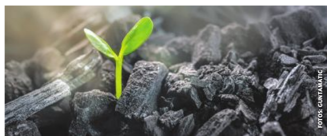
Saubere Bio-Pflanzenkohle mit Guntamatic

Big Bags ausgetragen wird. Der Landwirt erhält damit nicht nur