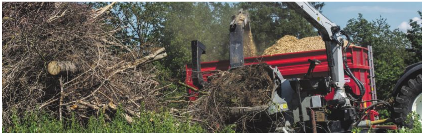
Mit grünen Energieträgern könnte der Sektor Land- und Forstwirtschaft eine Vorreiterrolle einnehmen und als erster fossilfrei betrieben werden.

Holz könnte bald eine wichtige Rolle bei der Herstellung von Treibstoffen spielen. In der Steiermark soll der neuen Technologie nun auf die Sprünge geholfen werden.