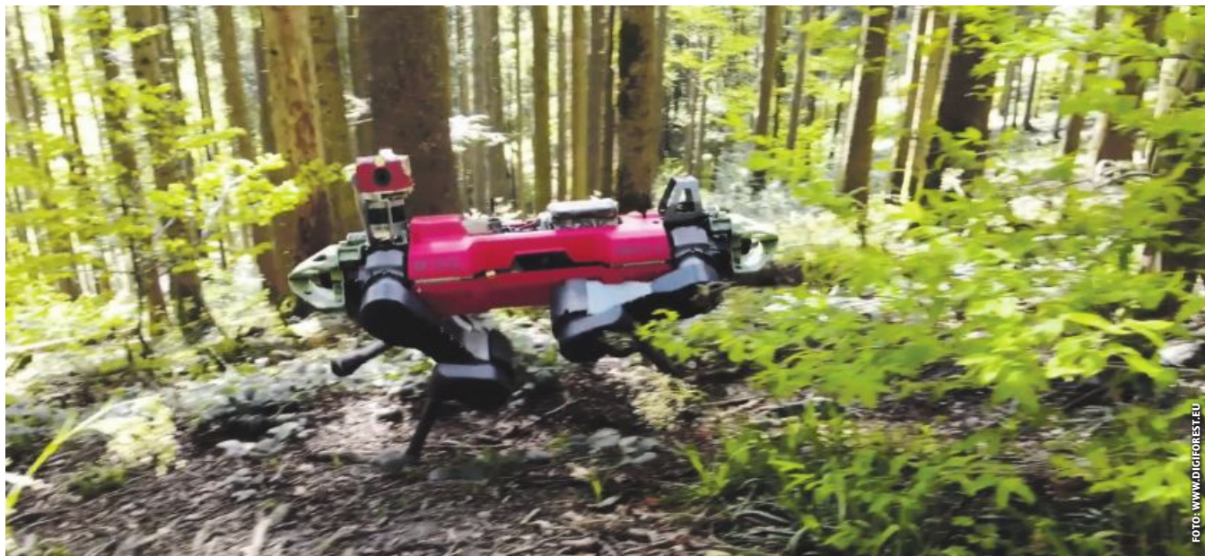
Waldinventur mittels Laserscanner – hier auf einem Schreitroboter montiert.