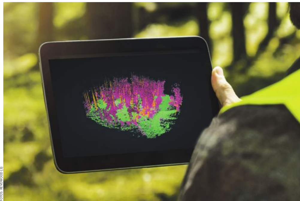
Nur knapp eine Stunde pro Hektar Wald – mittels RevoWood-Drohnen-Scan lassen sich bisher zeitraubende Bestandsaufnahmen sehr effizient erledigen.

Zukünftig sollen Auszeigeprozesse durch Algorithmen berechnet und über AR-Brillen, Smartphones oder Head-up-Displays im