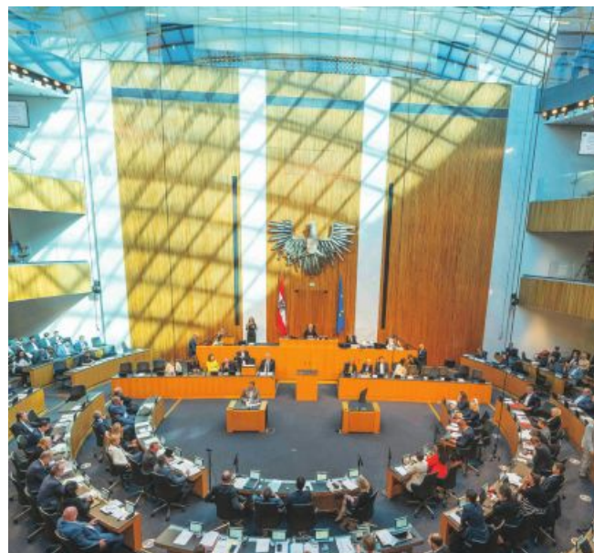
Konstituierende Sitzung des Nationalrats ist für 24. Oktober anvisiert.