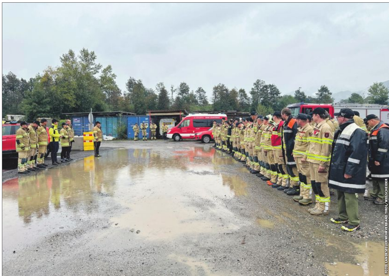
Nach den enormen Regenfällen bleibt die Situation in Niederösterreich weiter ernst. Nachdem LH Anton Mattle seiner niederösterreichischen Amtskollegin Johanna Mikl-Leitner Unterstützung für die lokalen Einsatzkräfte zugesagt hat, wurden am Montag zwei Feuerwehr-Katastrophenhilfszüge mit rund 122 Feuerwehrleuten, 34 Fahrzeugen sowie Spezialgerätschaften aus Tirol nach Niederösterreich entsandt. Mehr auf Seite 17.