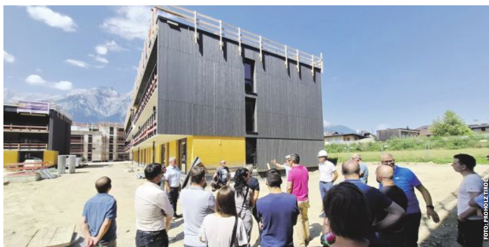
Das derzeit in der Ausführung befindliche Bauvorhaben umfasst fünf kompakte Baukörper mit 18 Mietwohnungen, 40 Eigentumswohnungen und sechs Reihenhäuser. Die komplette Wohnanlage bleibt im oberirdischen Bereich autofrei und bietet großzügige Grün- und Aufenthaltsbereiche.

Die Exkursion endete mit einer offenen Gesprächsrunde. Die Fertigstellung des Projekts ist für Sommer 2025 geplant. Die Gemeinde Volders freut sich bereits darauf, die ersten Bewohner in diesem wegweisenden Wohnprojekt willkommen zu heißen. Firmenmitteilung