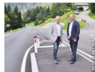
LH-Stv. Josef Geisler und LAbg. Bgm. Martin Mayerl auf der B 107 Großglockner Straße.

Nach knapp einem halben Jahr Bauzeit konnte das Straßenbauprojekt auf der B 107 Großglockner Straße erfolgreich abgeschlossen werden. Im Rahmen der Maßnahme wurde die Linksabbiegespur ins Debanttal errichtet sowie die zwei Busbuchten adaptiert. Zudem wurden Vorkehrungen für die geplante Oberflächenentwässerung der Landesstraße getroffen. „Durch diese baulichen Anpassungen konnte die Verkehrssicherheit in diesem Bereich der B 107 wesentlich erhöht werden“, freut sich LH-Stv. Josef Geisler bei einem Lokalaugenschein über die Fertigstellung des Projekts. LAbg. Martin Mayerl, Bürgermeister der Gemeinde Dölsach, pflichtet bei und führt weiter aus: „Durch die neuen Busbuchten haben wir zudem eine deutliche Qualitätssteigerung für den öffentlichen Nahverkehr und somit auch für die Bevölkerung erreicht.“