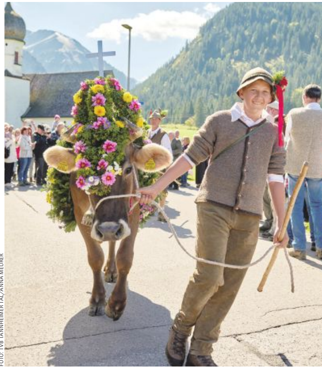
In Tannheim ist der traditionelle Almabtrieb ein großes Fest.