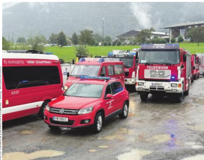
Die zwei Feuerwehr-Katastrophenhilfszüge brachen Montagmittag aus Kufstein in Richtung Niederösterreich auf.