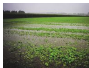
Die Böden sind vollgesogen und damit unbefahrbar.