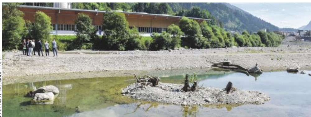
Ein Biotop mit einer Länge von 60 Metern und einer Breite von 30 Metern bietet unterhalb des ehemaligen Wehrs neuen Lebensraum.

Pflanzen geschaffen. Neuen Lebensraum bietet in diesem Bereich zudem ein Biotop mit einer Länge von 60 Metern und einer Breite von 30 Metern, welches von Grundwasser gespeist wird. Stellenweise wurden im Schotterkörper außerdem Initialbepflanzungen durchgeführt. „Projekte wie das Larsenwehr zeigen in vorbildlicher Weise, dass Hochwasserschutz und ökologische Aufwertung Hand in Hand gehen“, freut sich auch LH-Stv. Josef Geisler über den erfolgreichen Abschluss