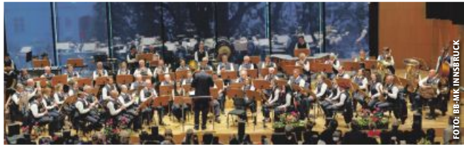
Die Bundesbahn-Musikkapelle Innsbruck

Zum ersten Mal spielen zwei Bahnkapellen zum gemeinsamen „Rail Bands in concert“ auf. Die Bundesbahn-Musikkapelle Innsbruck und der Eisenbahner-Musikverein Salzburg gastieren am 28. September um 18 Uhr mit einem einzigartigen Programm im ehrwürdigen Passionsspielhaus Erl.