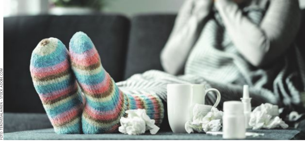
Taschentücher und Tee mit Honig helfen durch die Schnupfensaison.

Der Herbst ist der Übergang von der warmen zur kalten Jahreszeit, was auch dazu beitragen mag, dass besonders jetzt sehr viele Menschen an einer Erkältung leiden. In den Wohnungen und Häusern wird wieder mehr geheizt und diese trockene Heizungsluft trägt dazu bei, dass die Schleimhäute austrocknen und anfälliger für Bakterien und Viren werden. Generell halten sich wieder mehr Menschen über eine längere Dauer in geschlossenen Räumen auf, was ebenfalls dazu führt, dass Viren und Bakterien munter von einer Person zur nächsten übertragen