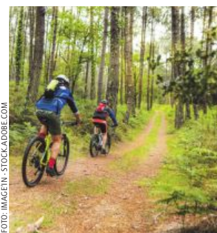
Bauern fordern Vertragslösungen.

Der Agrarsprecher der ÖVP im Nationalrat und Präsident des Österreichischen Bauernbundes, Georg Strasser, zeigt sich alarmiert: „Die SPÖ und die Naturfreunde wollen sämtliche Forstwege für Mountainbiker freigeben. Wir sagen klar Nein zu dieser maßlosen Beanspruchung von fremdem Eigentum, das von Waldbäuerinnen und Waldbauern mühevoll gepflegt wird. Für die Freizeitnutzung unserer Wälder mit Mountainbikes und anderen Sportgeräten braucht es Vertragslösungen und sicher kein Diktat von oben herab.“ Nur so könne die Erholungsfunktion von Österreichs Wäldern, die von den Land- und Forstwirten bewirtschaftet