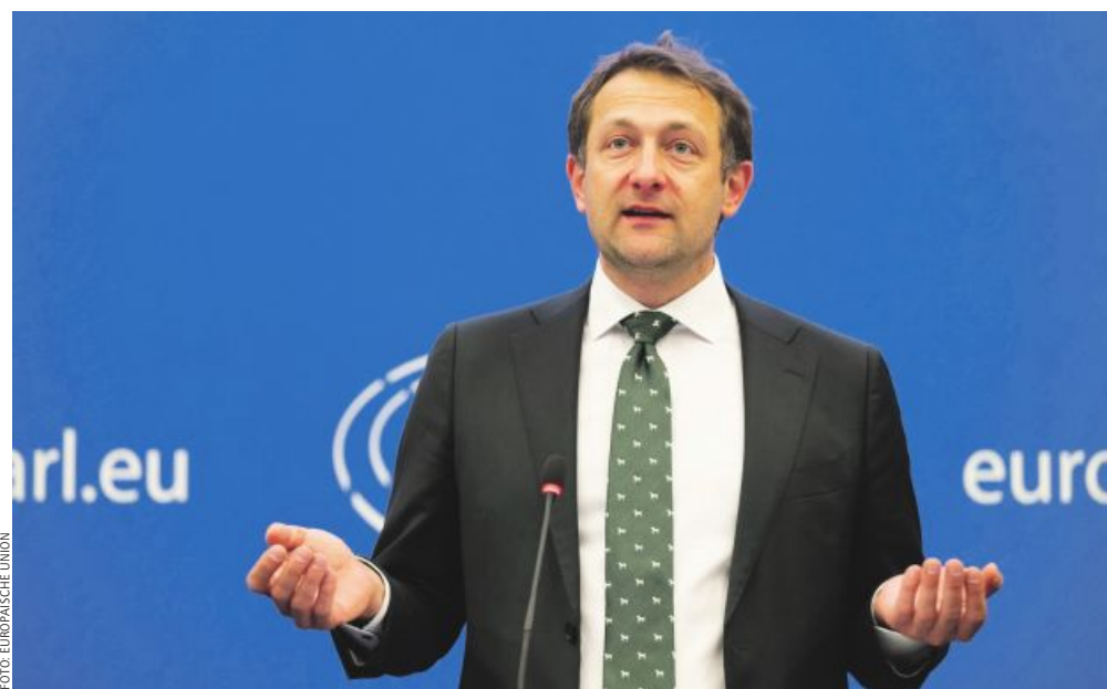
Mit Christophe Hansen übernimmt ein ausgebildeter Risikomanager in Brüssel das EU-Agrarressort.