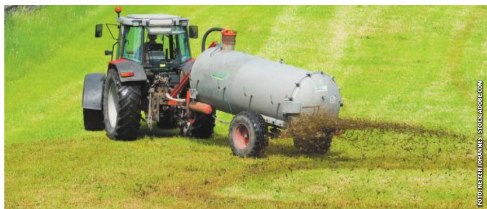
Mit dem Prallteller ist in Deutschland 2025 endgültig Schluss. Bayern schaffte eine Ausnahme.

Weiters unterstützt eine Wetterprognose bei der Auswahl des Ausbringungszeitpunktes und die App bezieht Wasserverdünnung der Gülle (auf einen Trockensubstanzgehalt von maximal 4,6 %) als alternatives Verfahren zur bodennahen Ausbringtechnik mit ein. Alle Ergebnisse kann sich der Anwender abschließend als PDF-Dokument ausgeben lassen.