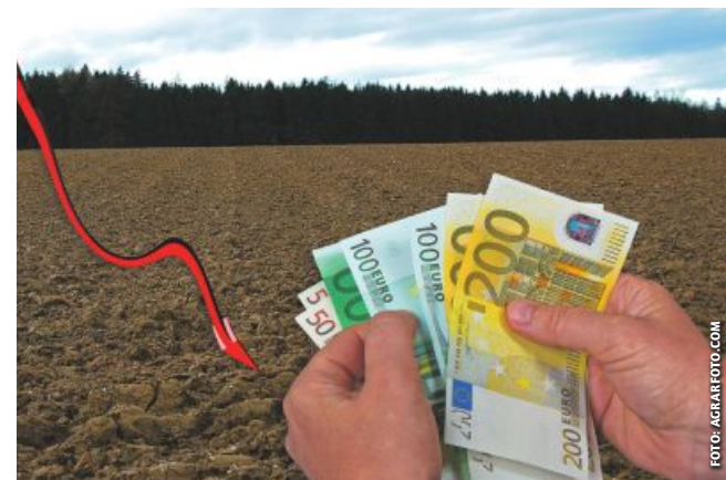
Nach der deutlichen Steigerung in der Vorperiode ergibt sich laut Agrarpreisindex für 2024 ein moderater Rückgang der Pachtzinse.

Viele Pachtverträge werden über den Agrarpreisindex (API) an die Ertragsituation in der Landwirtschaft angepasst. Bei älteren Pachtverträgen wird die Wertanpassung teilweise mithilfe des Getreidepreises durchgeführt. Aufgrund eines neuen Berechnungsverfahrens der Statistik Austria gibt es bei der Pachtzinsabrechnung 2024 mittels Index einige Änderungen.