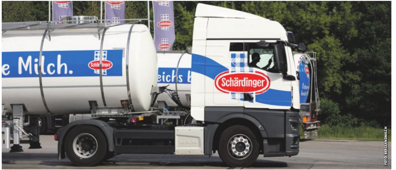
Österreichs größte Molkerei, die Berglandmilch mit ihrer Hauptmarke Schäringer, sammelt seit drei Jahrzehnten die Milch in sechs Bundesländern.