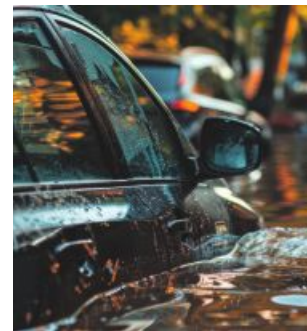
Hochwasser kann zu vielfältigen Schäden führen.

Rechtlich gilt zu beachten: Schäden sollten mit Fotos dokumentiert und unverzüg-