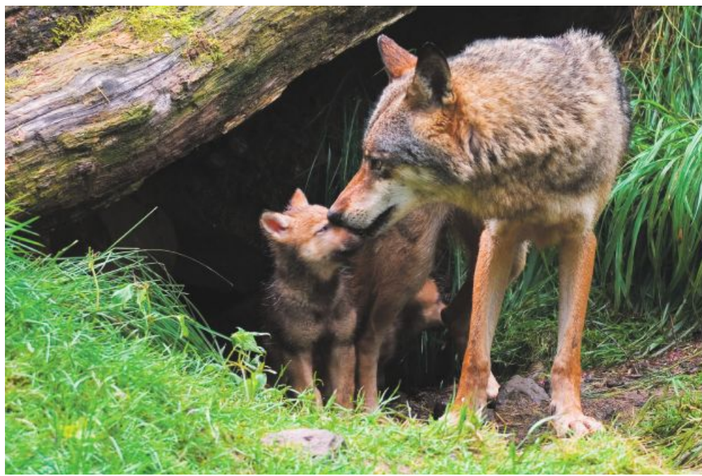
Das zuständige Bundesamt für Umwelt (BAFU) hat die Entnahme von zwei weiteren Rudeln erlaubt.

Erstmals griffen die Kantone im Jänner präventiv in die Wolfsbestände ein. Dieser