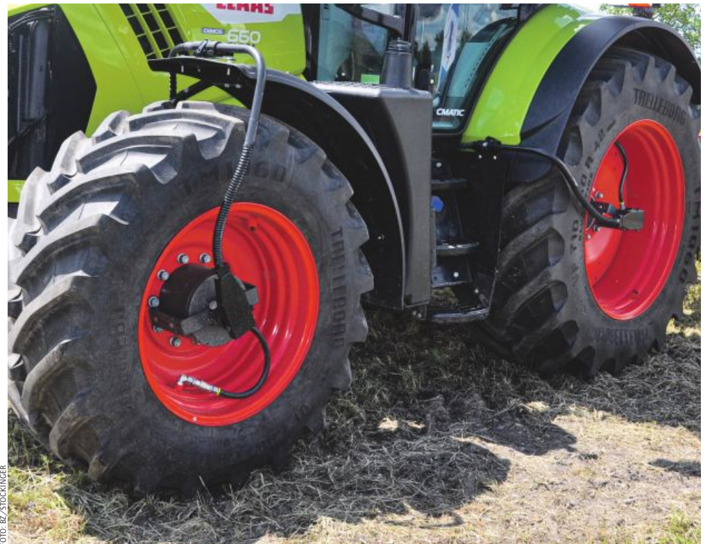
Immer mehr Hersteller bieten Reifendruckregelanlagen ab Werk oder zum Nachrüsten an.

Mindestens genauso wichtig wie der Reifen selbst ist