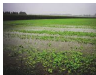
Die Böden sind vollgesogen und damit unbefahrbar.