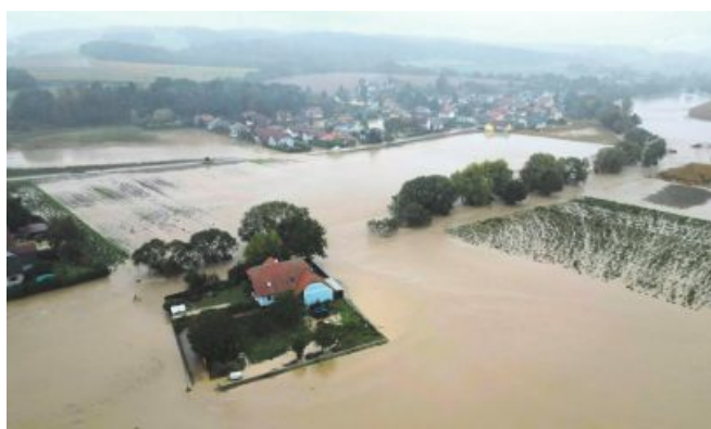
Ganz Niederösterreich wurde zum Katastrophengebiet erklärt.

In weiten Teilen Österreichs sind die Böden vollgesogen wie ein Schwamm, so sie nicht überhaupt unter Wasser stehen. Noch stehen vielerorts Mais, Sonnenblumen, Sojabohnen oder Zuckerrüben auf den Feldern. Die Kürbis- und Weinernte ist nicht abgeschlossen. Im Grünland ist der letzte