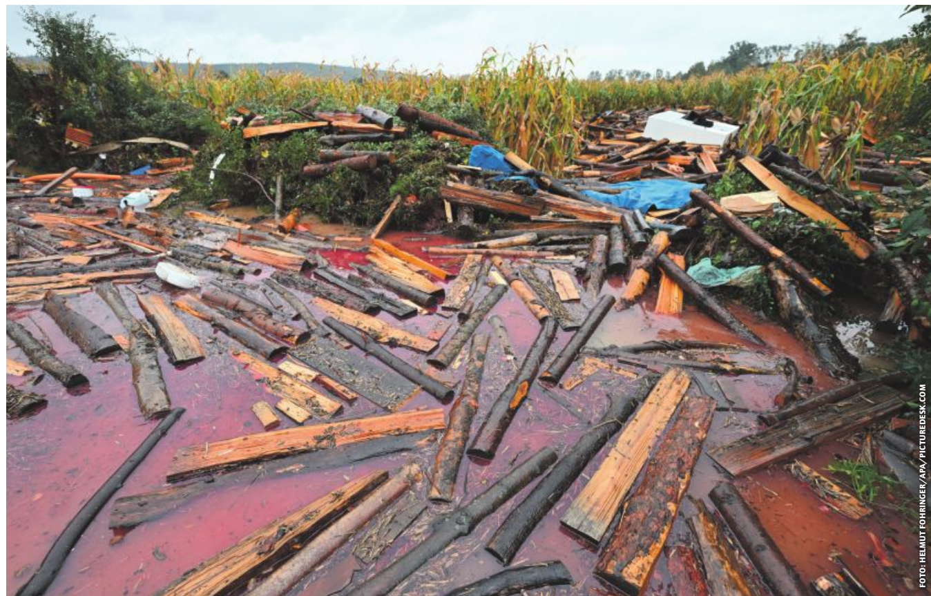
Angeschwemmtes Holz und Treibgut auf einem Acker. Eine der Folgen des Hochwassers, welche die Bauern wochenlang beschäftigen werden.