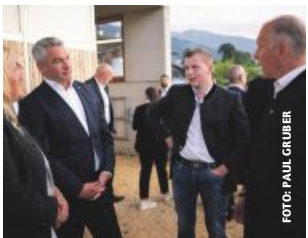
Nehammer kennt Bauernsorgen.

Bundeskanzler Karl Nehammer hat – knapp vor der Hochwasserkatastrophe – die BauernZeitung zu einem Exklusiv-Interview gebeten. Ein Gespräch über die Probleme und Anliegen der Bäuerinnen und Bauern, in dem der ÖVP-Chef der Landwirtschaft auch einige Zusagen macht. Karl Nehammer: „Wir haben stets auf die Bauern geschaut und werden das auch in Zukunft tun.“