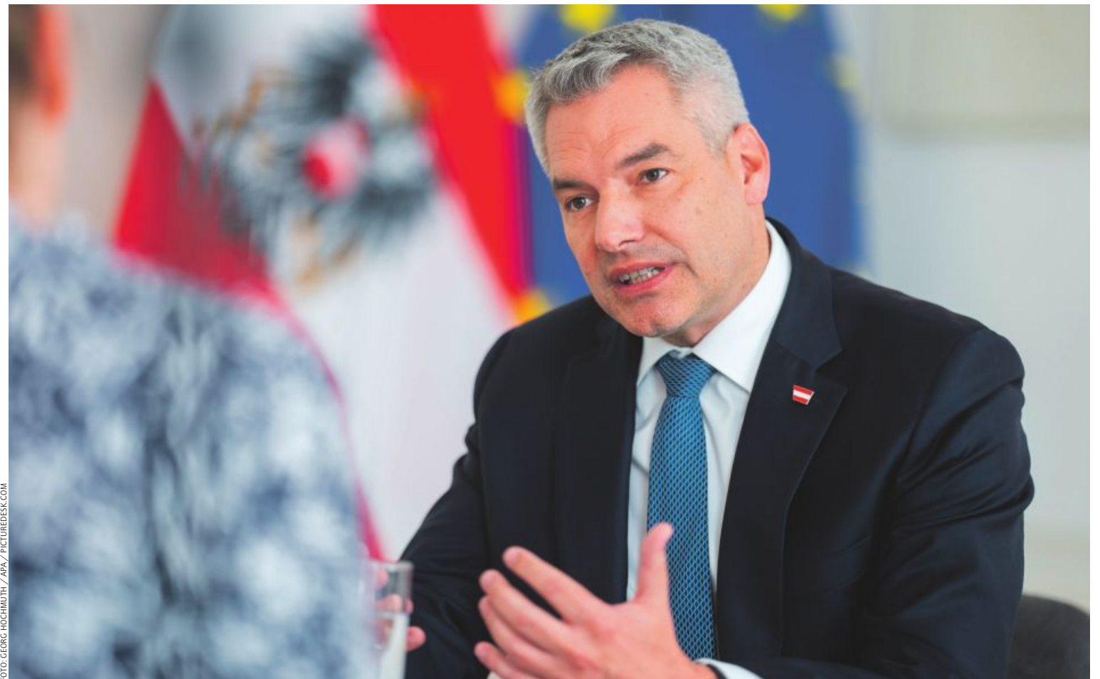
Karl Nehammer: „Man muss nur aus dem Fenster schauen, um sich der Bedeutung der Landwirtschaft in unserem Land bewusst zu werden.“

Unsere Bäuerinnen und Bauern brauchen wettbewerbsfähige Rahmenbedingungen, damit ganz Österreich von regionaler Lebensmittelqualität profitieren kann und Ver-