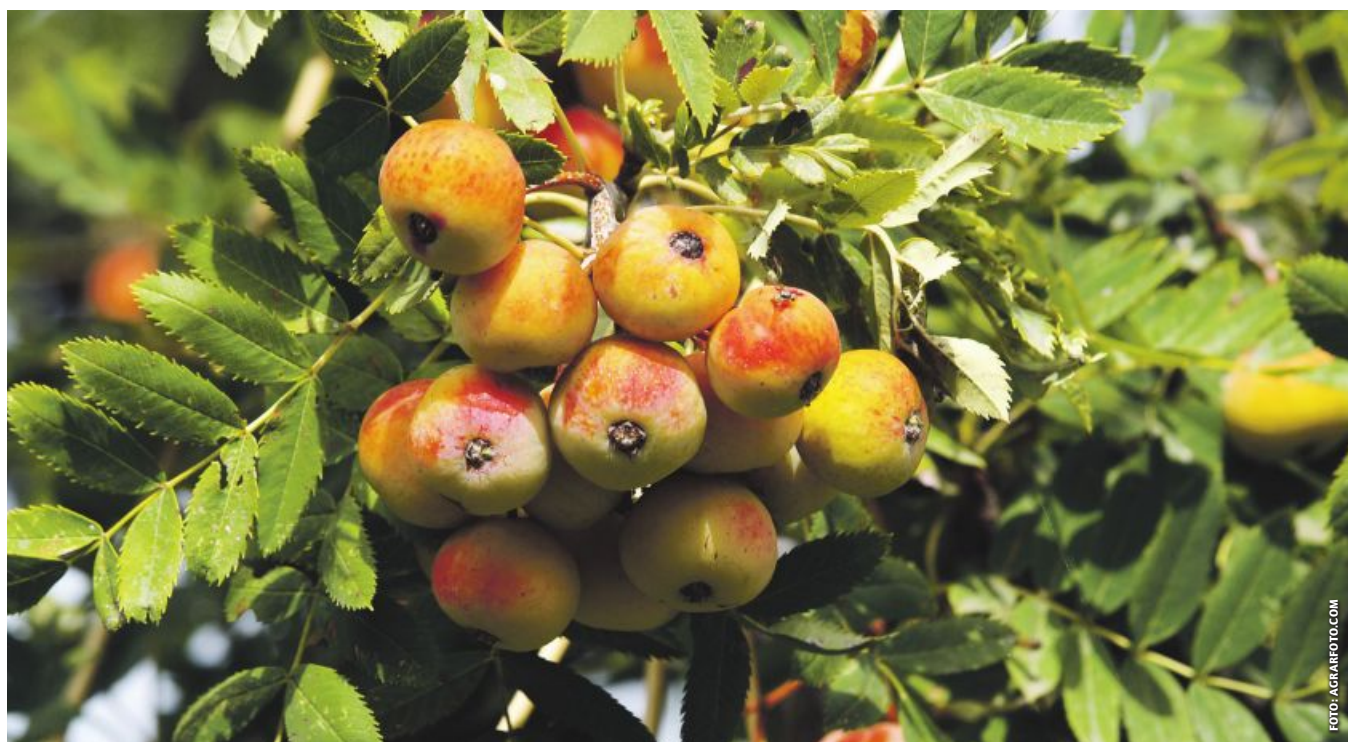
Sein Holz ist das härteste überhaupt unter den heimischen Baumarten und seine mundenden Früchte lassen sich hervorragend destillieren.