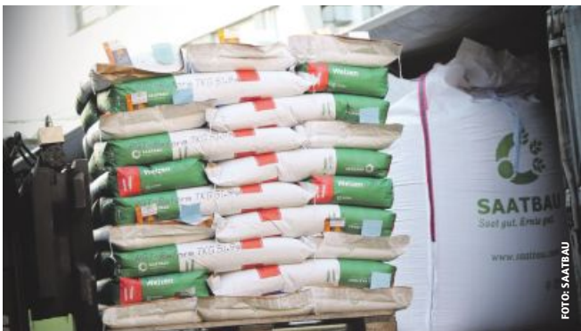
Das Saatbau-Portfolio: rund 600 Sorten von 85 Kulturarten.

Die Saatbau Linz will weiter auf die erfolgreiche Züchtung klimafitter Kulturpflanzen setzen. 2023 wurden insgesamt 50 Saatbau-Sorten zugelassen, darunter zehn in Österreich. Stärkster Umsatzbringer ist und bleibt Saatmais. Dessen Absatz konnte überall gesteigert werden, der Anteil international verkaufter Einheiten liegt bei über 80 Prozent.