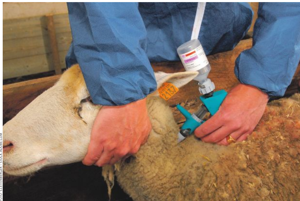
Der Serotyp 3 des Blauzungen-Virus löst vor allem bei Schafen schwere Krankheitsverläufe aus. Bei knapper Impfstoffverfügbarkeit sollten deshalb vorrangig Schafe und Ziegen geimpft werden.

zuchtorganisationen getroffen. Abstimmungsgespräche mit den wichtigsten Exportländern sind im Gange. Der Status „frei von BTV“ ist wieder erreicht, wenn über insgesamt 24 Monate hinweg kein neuer Ausbruch festgestellt wurde.