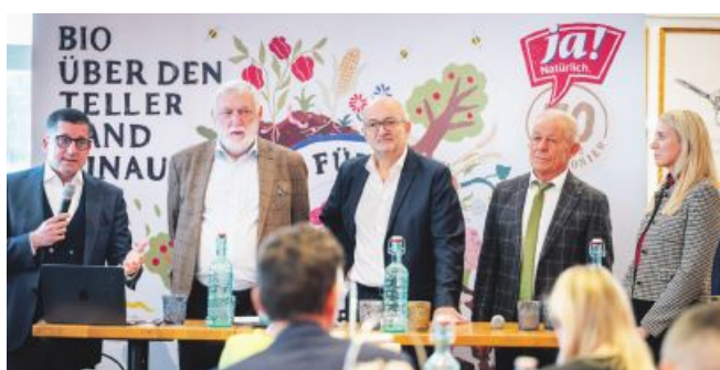
Rewe-Spitze zog Bilanz, von Franz Fischler (2. v. li.) gab es viel Lob.

Dem pflichtete auch Franz Fischler, damals Landwirtschaftsminister und kurze Zeit später EU-Agrarkommissar, bei: „Wir mussten weg davon, dass Bio nur in Reformhäusern und auf Märkten vertrieben wird.“ Während unter den Bioverbänden jedoch Zwi- st über die jeweiligen Standards vorherrschte, sei dem Rewe-Konzern durch ehrgeizige Richtlinien über den gesetzli-