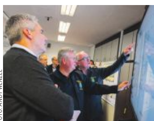
Bundeskanzler Karl Nehammer in der Einsatzzentrale in Tulln.

Schnitt im heurigen Jahr in Gefahr. Die anstehende Herbstsaat des Wintergetreides wird sich noch um viele Tage oder einige Wochen verschieben. Viel zu nass sind die Ackerböden, um mit Erntemaschinen, Traktoren und Anbaugeräten darauf fahren zu können.