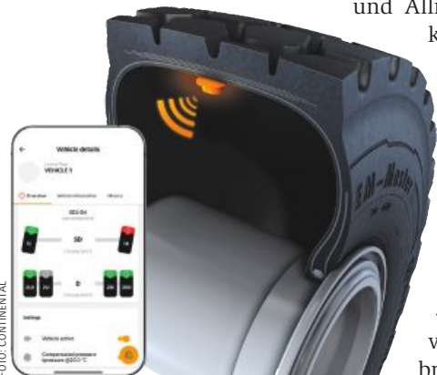
Über Sensoren und Bluetooth werden Reifenparameter am Smartphone angezeigt.

• Tipp: Für Reifendruckregelanlagen wird unter bestimmten Rahmenbedingungen ein Investitionszuschuss von 40 Prozent gewährt. Nähere Infos geben die Bezirksbauernkammern.