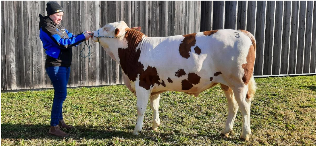
Der genetisch reinerbig hornlose Ingmar-Sohn Iniesta PP* wurde von der Göpel Genetik (D) vom Betrieb Schrems aus Mettmach eingekauft.