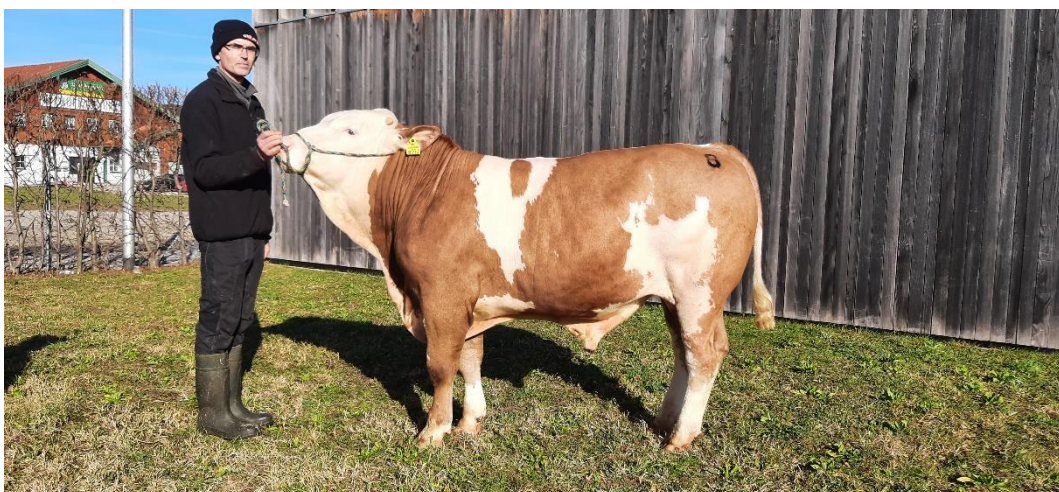
An die Besamungsstation Natural in der Nähe von Prag übersiedelt ein genetisch hornloser Hashtag-Sohn.